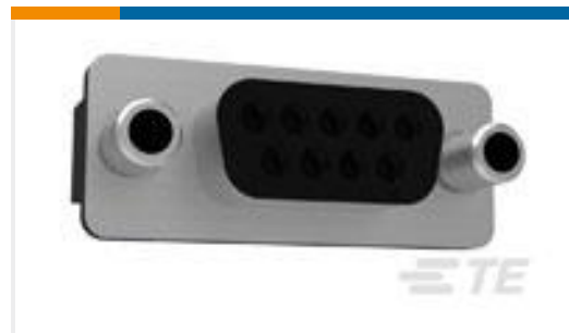
TE 系列/零件编号5750678-1 09 RCPT SP/FMS (RET SL)