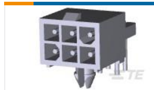
TE 系列/零件编号1-770969-1 06P MINI UMNL R/A HDR ASSY LF