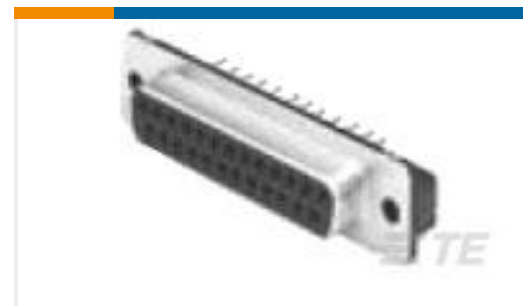
TE 系列/零件编号5787683-1 15 RCPT SP/FMS SCRLK