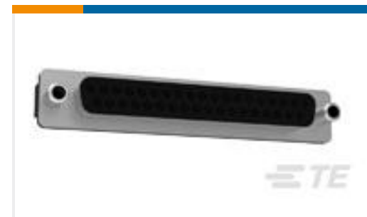
TE 系列/零件编号5787685-1 37 RCPT SP/FMS (RET SL)