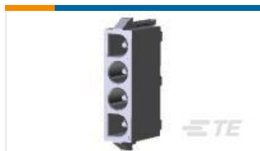
TE 系列/零件编号641968-1 04P UMNL PIN HDR ASSY POL 94VO