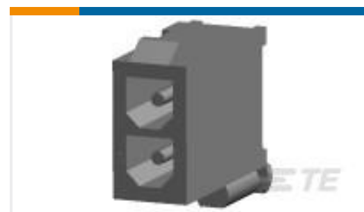
TE 系列/零件编号1-770166-1 02P MINI UMNL ASSY VO SNAU LF