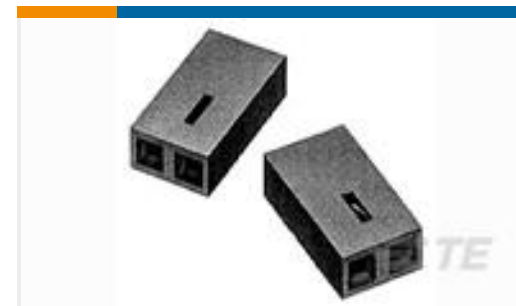
TE 系列/零件编号530153-2 TDM SPRING SHUNT ASSY 2 POS