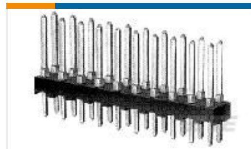
TE 系列/零件编号87227-7 14 MODII HDR DRST UNSHRD .100