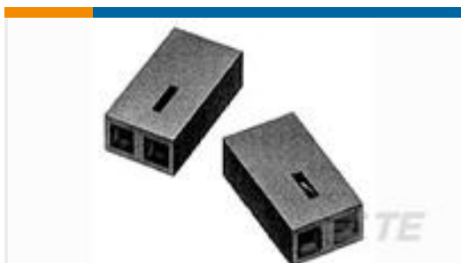
TE 系列/零件编号390088-2 BLACK HSG WITH 15AU CONTACT