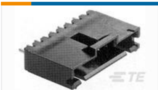
TE 系列/零件编号5-104363- 5 06 MTE HDR SRST LATCH . 100CL