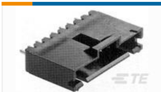
TE 系列/零件编号5-104362- 2 03 MTE HDR SRST LATCH W/HLDWN