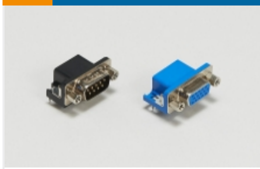
PCB D-Sub 连接器(353)