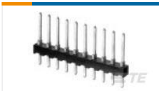
TE 系列/零件编号87224-3 03 MODII HDR SRST UNSHRD .100