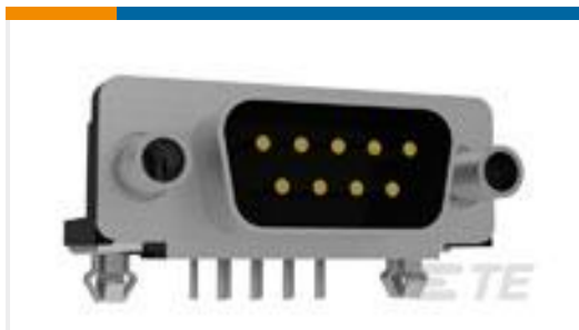
TE 系列/零件编号5747840-6 HD-20 PLUG RA .318 FMS BD-LK S