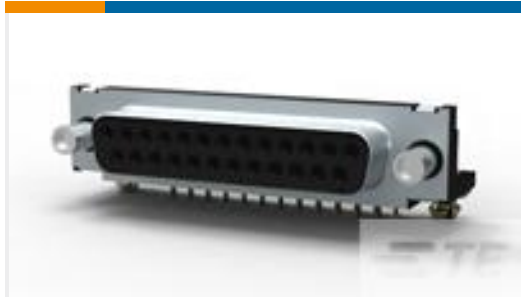
TE 系列/零件编号5747846-6 25 MSFL RCPT RA 318 (SL, FM,BL)