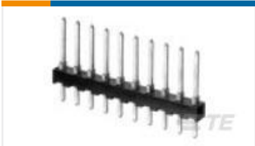
TE 系列/零件编号87220-2 02 MODII HDR SRST UNSHRD .100