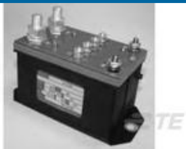
TE 系列/零件编号1- 1616058-6 A703GC=RELAY