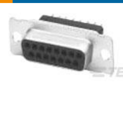
TE 系列/零件编号745187-7 25 RCPT SP/MS STD