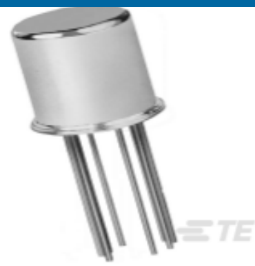
TE 系列/零件编号1617118-7 J1MAC-26XPS = M39016 /7-036P