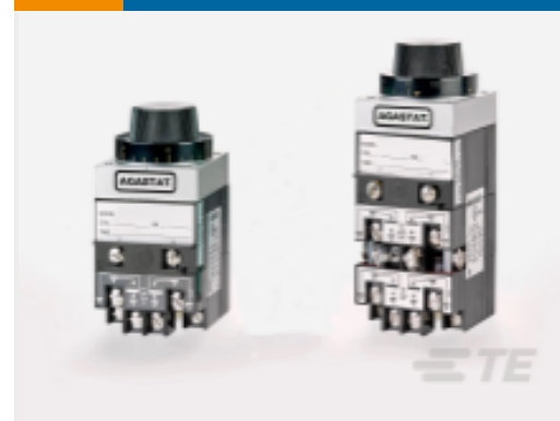
TE 系列/零件编号4- 1472973-2 7012OBY1=RLY,STD,ON, 2P,24VDC,5SEC,OPT L