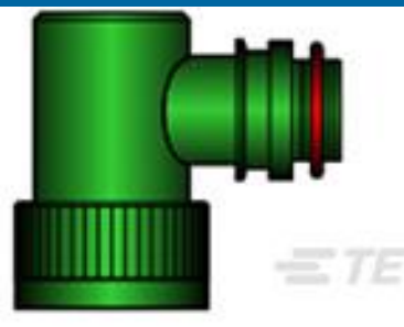
TE 系列/零件编号C76413- 000 TXR40SJ90-1410BI