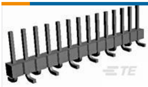
TE 系列/零件编号146128-1 03 MODII HDR SR SFMNT B/A .100