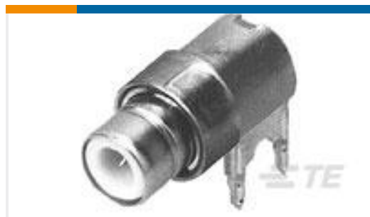
TE 系列/零件编号228435-1 CONN COMML SMB RT ANGLE PCB