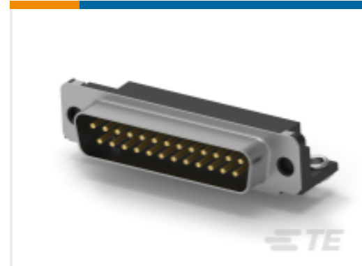
TE 系列/零件编号 5747238-2 25 MSFL PLUG RA 318 (FM)