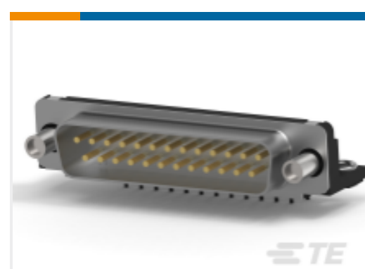
TE 系列/零件编号 5747238-6 25 MSFL PLUG RA 318 (SL, FM)