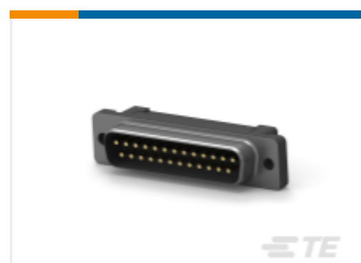
TE 系列/零件编号 1658613-2 25 POS HDF PLUG, MS, LEAD FREE