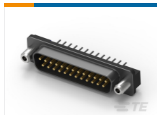
TE 系列/零件编号 1-5745968-6 25 PLUG SP/FMS SCRLK