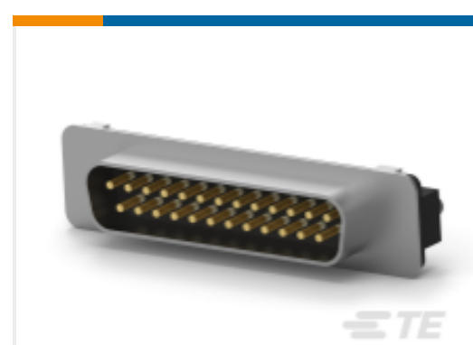
TE 系列/零件编号 2-5747704-0 25 PLUG SP/FMS BRDLK