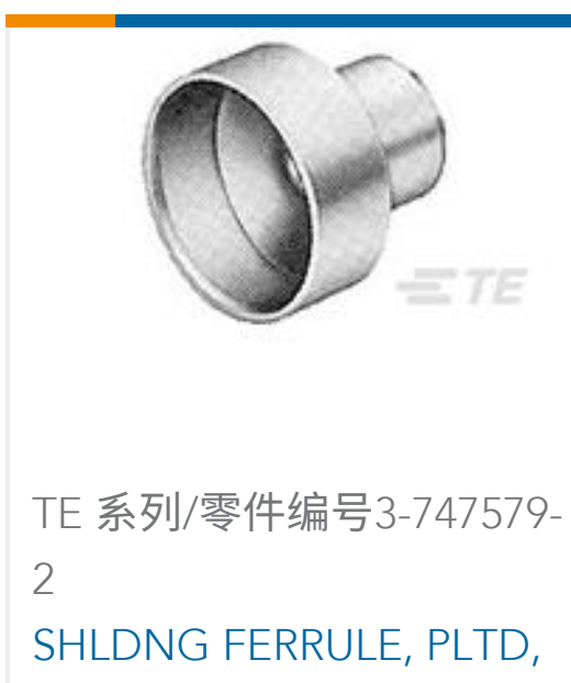
TE 系列/零件编号 3-747579-2 SHLDNG FERRULE, PLTD, BULK PKG