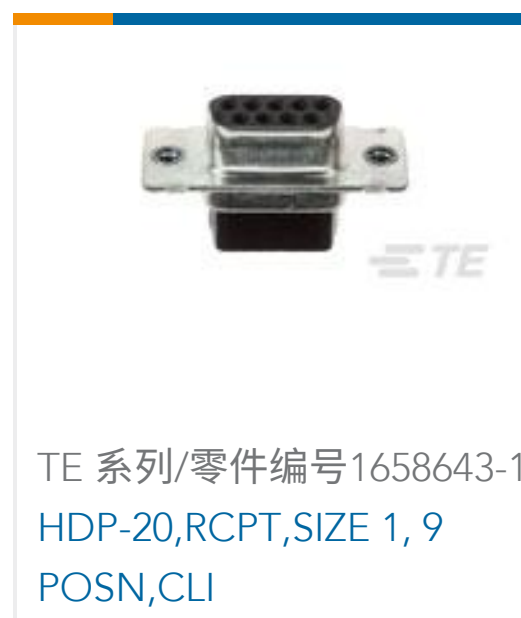
TE 系列/零件编号 1658643-1 HDP-20, RCPT, SIZE 1, 9 POSN, CLI