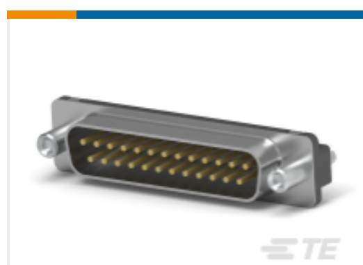
TE 系列/零件编号 5748027-1 25 PLUG SP/FMS (IN,SL)