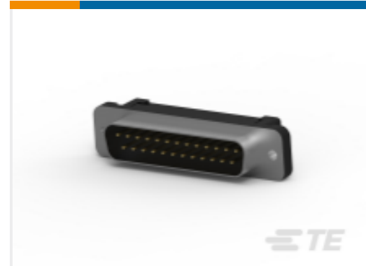
TE 系列/零件编号 1658608-2 25 POS HDF PLUG, MS, LEAD FREE