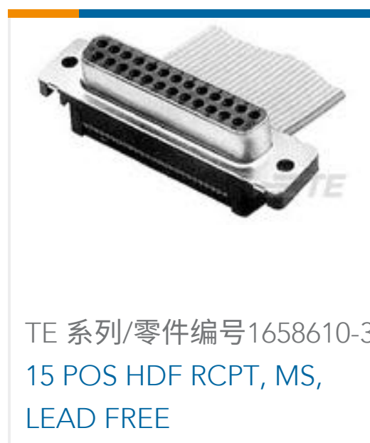
TE 系列/零件编号 1658610-3 15 POS HDF RCPT, MS, LEAD FREE