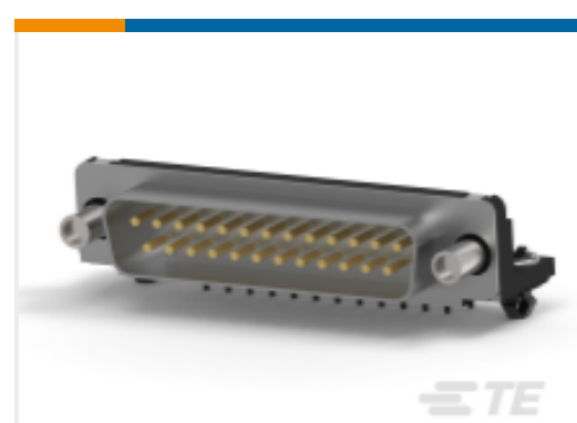
TE 系列/零件编号 5747842-6 25 MSFL PLUG RA 318 (SL, FM,BL)