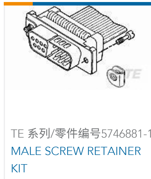
TE 系列/零件编号 5746881-1 MALE SCREW RETAINER KIT