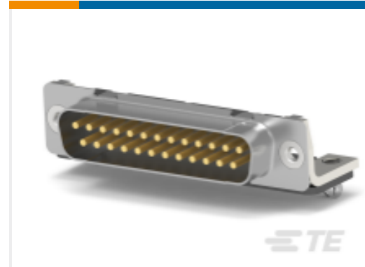
TE 系列/零件编号 1-338170-2 25P.HDP20 PLUG ASSY