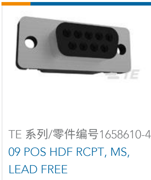
TE 系列/零件编号 1658610-4 09 POS HDF RCPT, MS, LEAD FREE