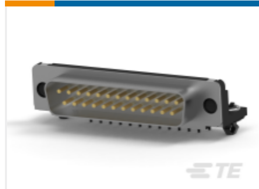
TE 系列/零件编号 5747842-4 25 MSFL PLUG RA 318 (IN, FM,BL)