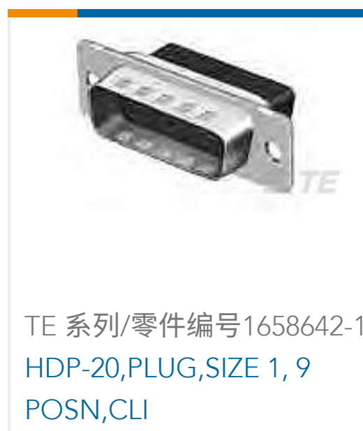
TE 系列/零件编号 1658642-1 HDP-20, PLUG, SIZE 1, 9 POSN, CLI