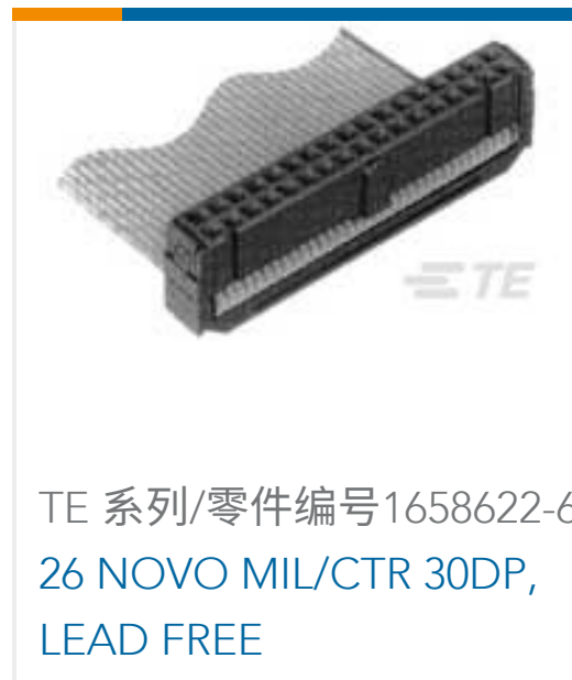
TE 系列/零件编号 1658622-6 26 NOVO MIL/CTR 30DP, LEAD FREE