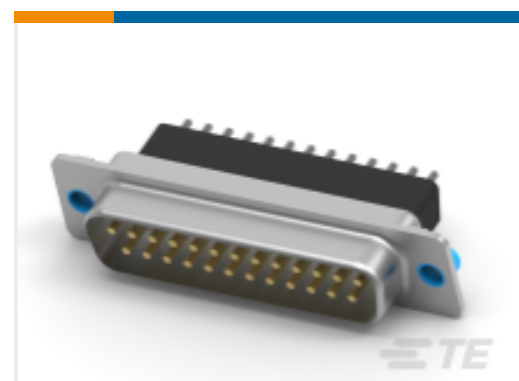
TE 系列/零件编号 5745959-1 25 PLUG SP/MS CNUIT