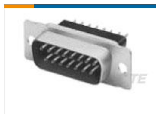
TE 系列/零件编号 5745412-7 25 PLUG SP/MS STD