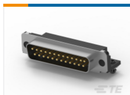
TE 系列/零件编号 747842-4 25 MSFL PLUG RA 318 (IN, FM,BL)