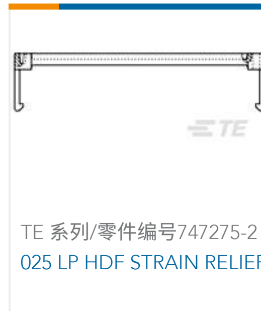
TE 系列/零件编号 747275-2 025 LP HDF STRAIN RELIEF KIT