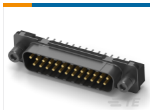
TE 系列/零件编号 3-338311-2 25POS.HD20 PLG ASSY