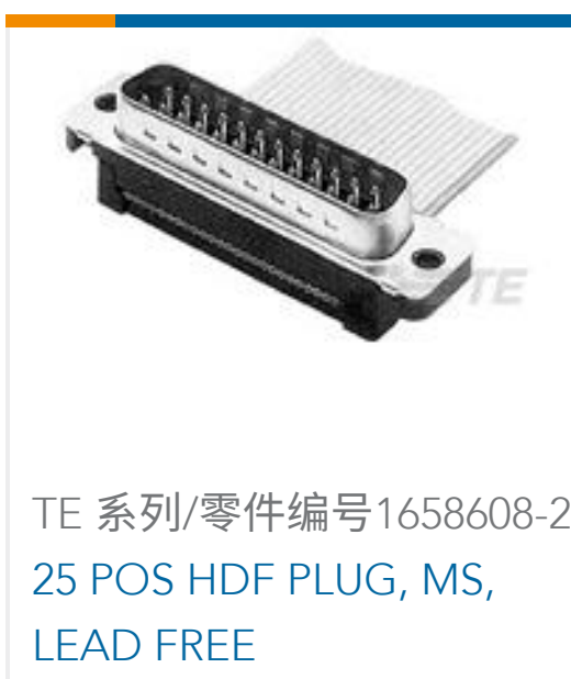
TE 系列/零件编号 1658608-2 25 POS HDF PLUG, MS, LEAD FREE