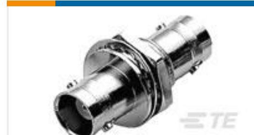
TE 系列/零件编号1- 1478046-0 BNC BH Adp JJ 50Ohm Silver Plt