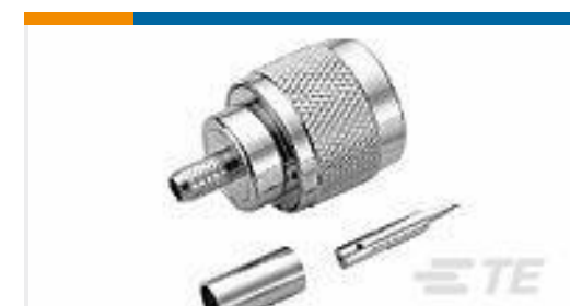
TE 系列/零件编号1- 1337410-0 N Str Plg Hex 50Ohm Silver Pltd PSF 1/4M