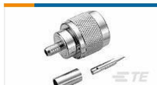
TE 系列/零件编号1- 1337416-0 N Str Plg Hex 50Ohm Silver Pltd RG58C/U,