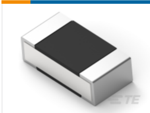
TE 系列/零件编号2176310-4 RP 1E 0.1W 115R 0.1% 25PPM 1K RL