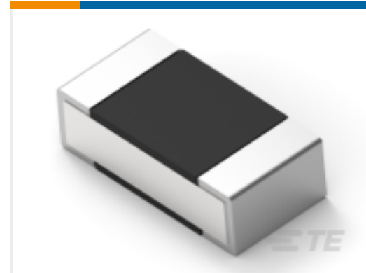
TE 系列/零件编号9- 2176310-9 RP 1E 0.1W 1K13 0.1% 25PPM 1K RL