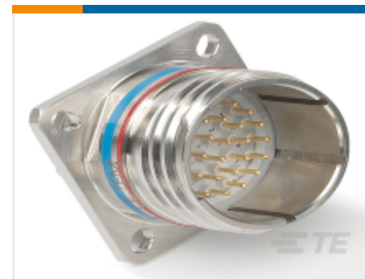
TE 系列/零件编号 YDTS20F11-02PN6149 DTS20F11-02PN-6149