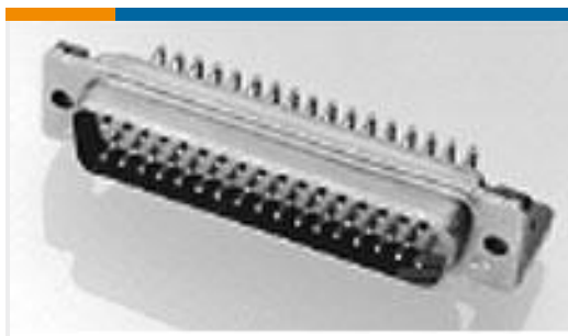
TE 系列/零件编号1757841-4 AMPLIMITE,PLUG ASY,R /A,109,ZN,4