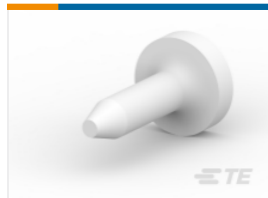
TE 系列/零件编号 206509-1 SIZE 20 KEYING PLUG