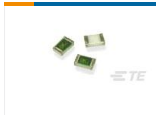
TE 系列/零件编号 2176092-6 RP 2A 0.25W 732R 0.1% 25PPM 1K RL