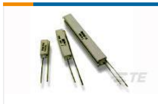
TE 系列/零件编号 3-1623729-1 BCHE 17 W 12R 10%