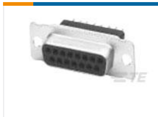
TE 系列/零件编号 5745185-1 15 RCPT SP/MS STD