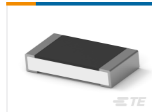
TE 系列/零件编号 6-2176389-5 RQ 1206 499R 0.1% 10PPM 5K RL