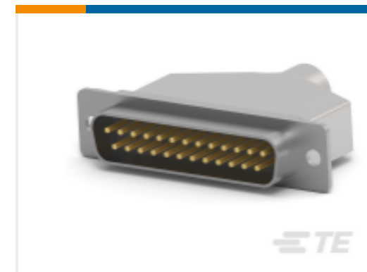
TE 系列/零件编号 1-747547-0 KIT, PLUG, 25P, HDE, SHLD HDWRE