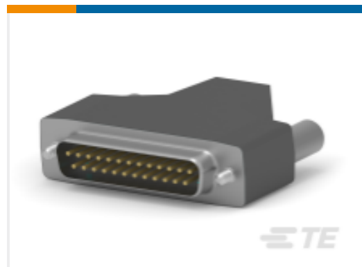
TE 系列/零件编号 1-747948-8 KIT, PLUG, 25P, HDE, SHLD ENCLSRE