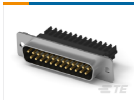
TE 系列/零件编号 1-745496-8 25 HDE MS PLUG, 22-26, LEAD FREE