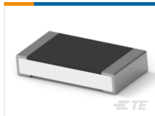
TE 系列/零件编号 8-2176391-8 RQ 1206 100K 0.1% 10PPM 5K RL