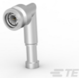
TE 系列/零件编号 1-225554-1 TNC-DUAL CMP R/ANGLE PLUG-W/P