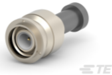
TE 系列/零件编号 522555-6 TNC PLUG DUAL W/P TR