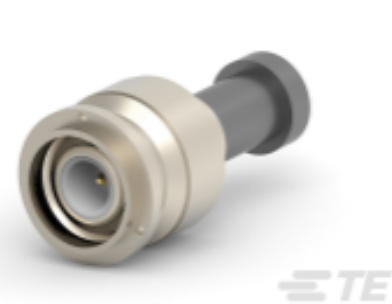
TE 系列/零件编号 225555-6 TNC PLUG DUAL W/P TR