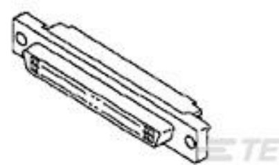
TE 系列/零件编号 5-749877-9 100 50SR PANEL MOUNT RCPT, ROHS