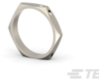
TE 系列/零件编号 1-329631-2 JAM NUT, PLATED