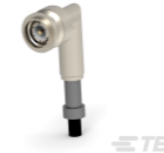
TE 系列/零件编号 5225559-2 TNC RT ANG PLUG DUAL W/P TR