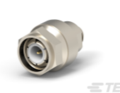
TE 系列/零件编号 228179-3 PLUG, WEATHER PROOF, SERIES TNC