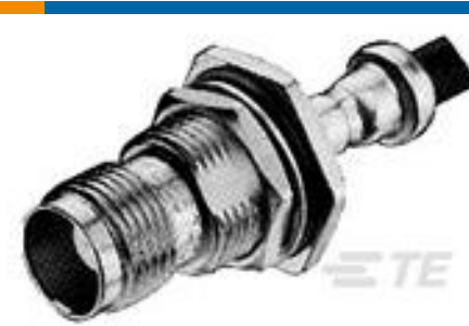
TE 系列/零件编号 414168-3 JACK, BULKHEAD, COM'L TNC