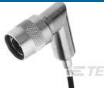
TE 系列/零件编号 414173-6 COML TNC R/A PLUG