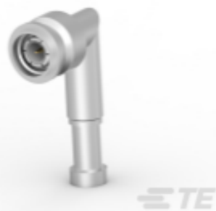
TE 系列/零件编号 225554-6 TNC RT ANG PLUG DUAL W/P