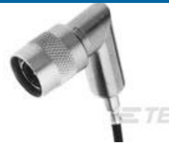
TE 系列/零件编号 5414173-6 COML TNC R/A PLUG