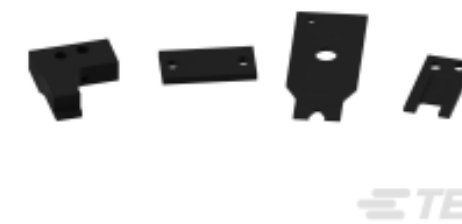
TE 系列/零件编号 463310-8 BLADE, STRIPPING #26