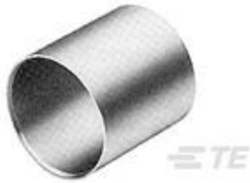
TE 系列/零件编号 2-747580-2 SHLDING FERRULE, PLTD TIN, BULK