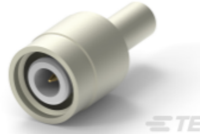
TE 系列/零件编号 5-1814800-3 TNC Str Plg Hex 50Ohm Nickel Pltd RG58C