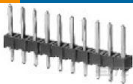
TE 系列/零件编号 5-146293-8 08 MODII HDR SRST B/A 100 W/HD