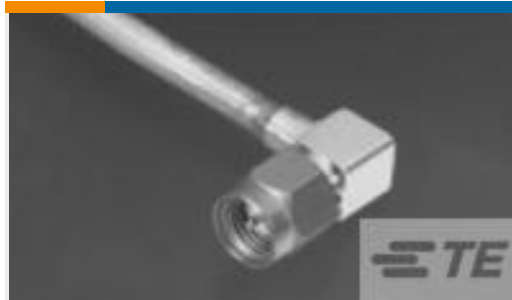
TE 系列/零件编号 1051113-1 2007 5055 00, OSM CABLE PLUG