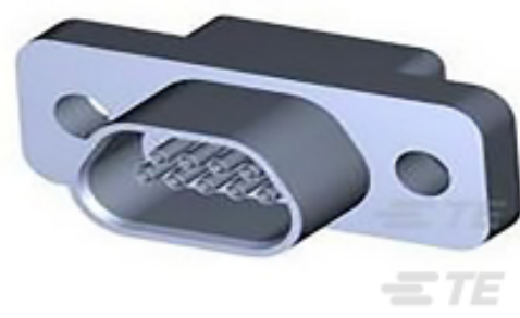
TE 系列/零件编号 1532210-2 M83513/01-BC, MCKS-C2- B-15PS