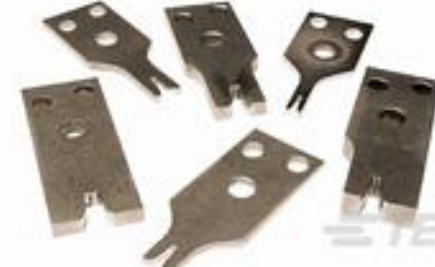
TE 系列/零件编号 1-456401-6 CRIMPER, WIRE .042 "F"