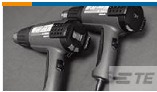
TE 系列/零件编号 CJ2087-000 HL2010E-KIT-120V