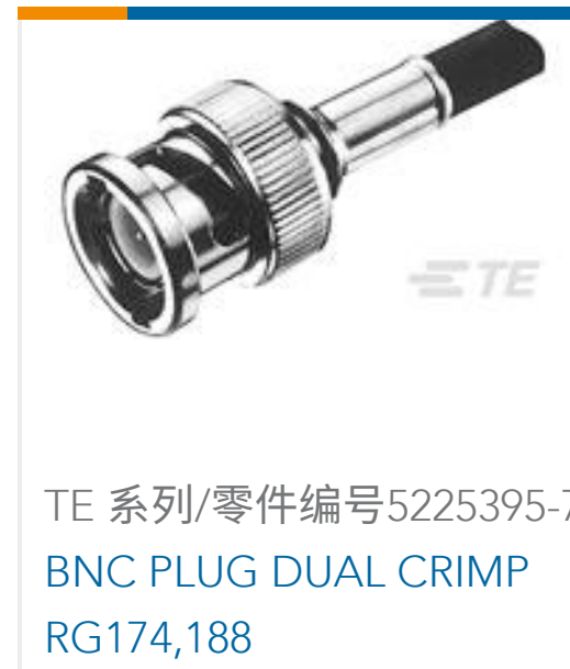
TE 系列/零件编号5225395-7 BNC PLUG DUAL CRIMP RG174,188