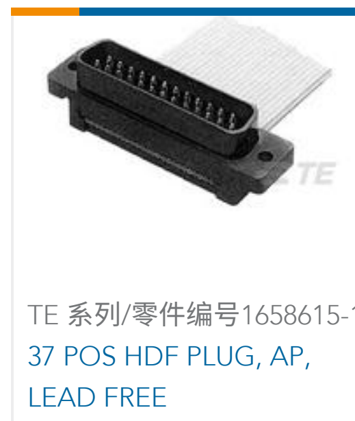
TE 系列/零件编号1658615-1 37 POS HDF PLUG, AP, LEAD FREE