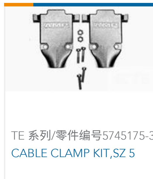
TE 系列/零件编号5745175-3 CABLE CLAMP KIT,SZ 5