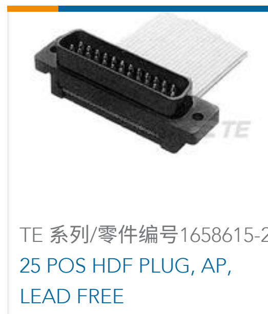
TE 系列/零件编号1658615-2 25 POS HDF PLUG, AP, LEAD FREE