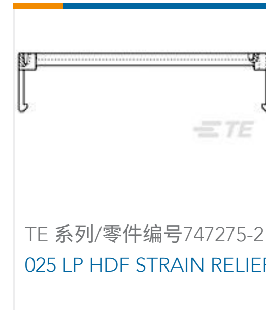
TE 系列/零件编号747275-2 025 LP HDF STRAIN RELIEF