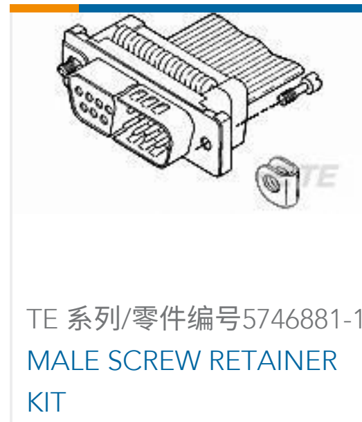
TE 系列/零件编号5746881-1 MALE SCREW RETAINER KIT