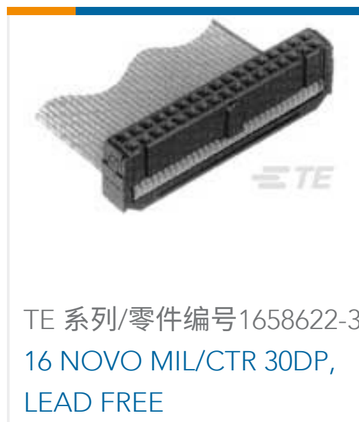
TE 系列/零件编号1658622-3 16 NOVO MIL/CTR 30DP, LEAD FREE