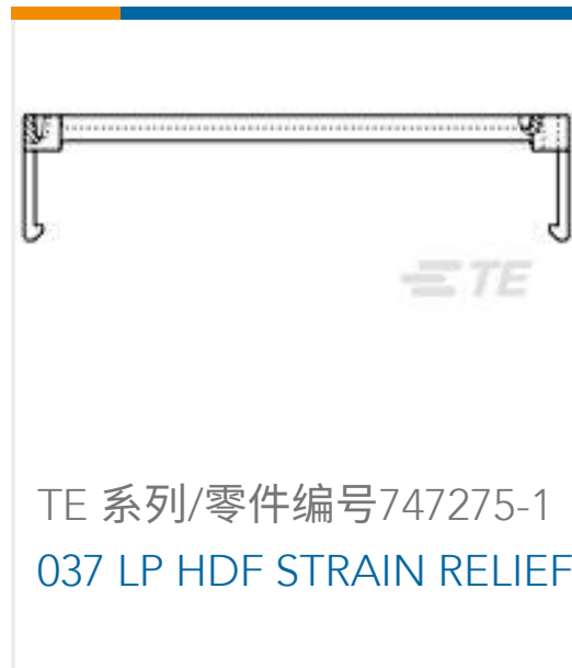
TE 系列/零件编号747275-1 037 LP HDF STRAIN RELIEF