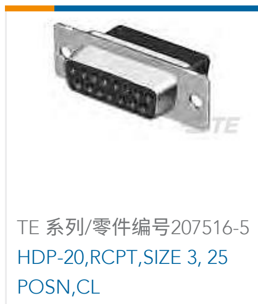
TE 系列/零件编号207516-5 HDP-20,RCPT,SIZE 3, 25 POSN,CL