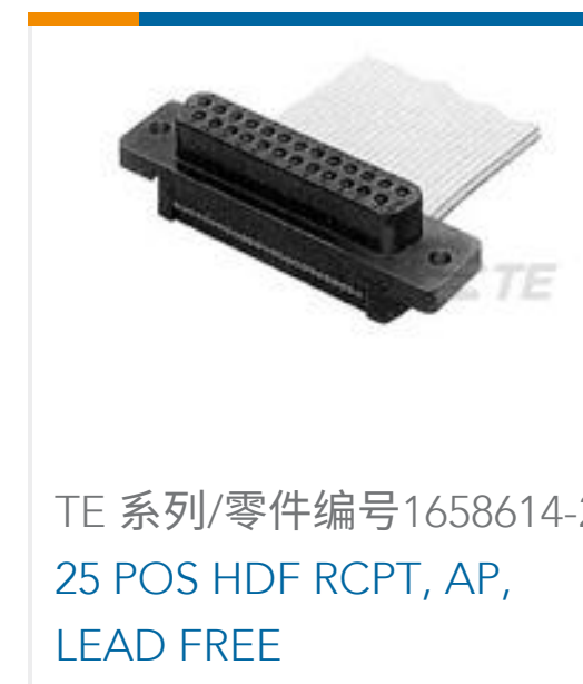
TE 系列/零件编号1658614-2 25 POS HDF RCPT, AP, LEAD FREE