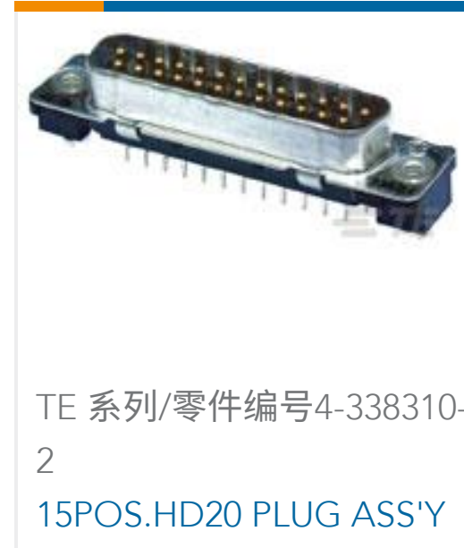
TE 系列/零件编号4-338310- 2 15POS.HD20 PLUG ASS'Y