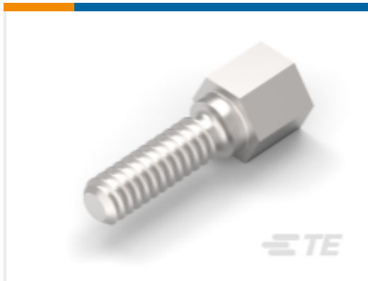
TE 系列/零件编号 749087-4 50SR SCREWLOCK KIT, FEMALE