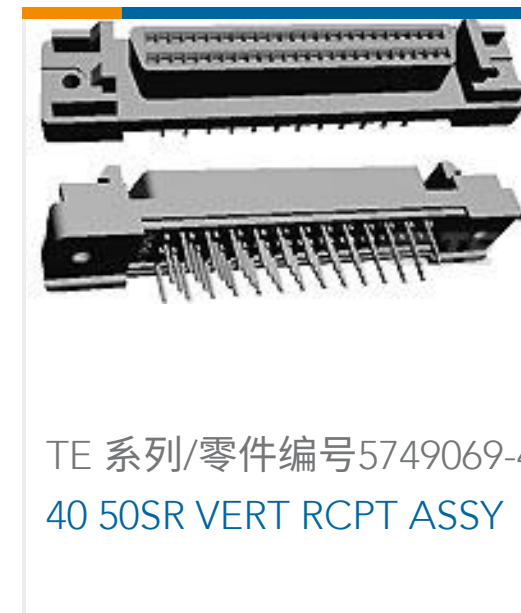
TE 系列/零件编号5749069-4 40 50SR VERT RCPT ASSY