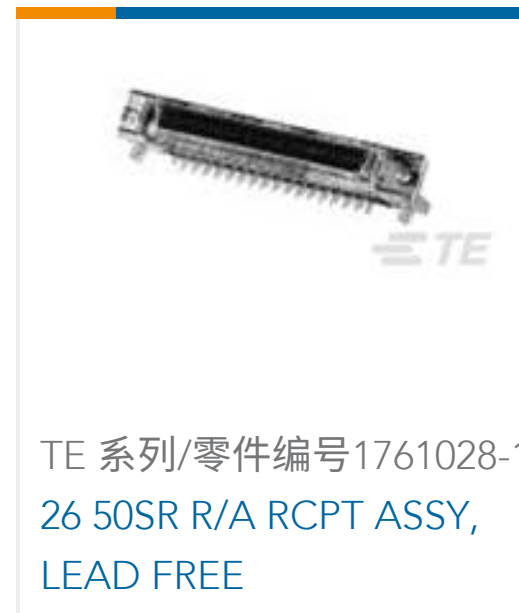
TE 系列/零件编号1761028-1 26 50SR R/A RCPT ASSY, LEAD FREE