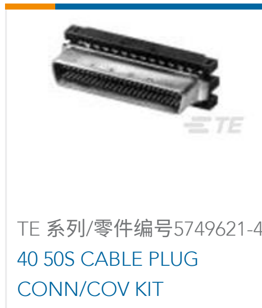
TE 系列/零件编号5749621-4 40 50S CABLE PLUG CONN/COV KIT