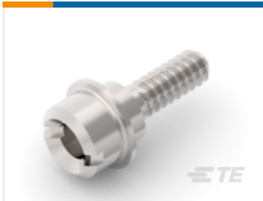
TE 系列/零件编号 786585-2 50SR SCREWLOCK KIT, FEMALE