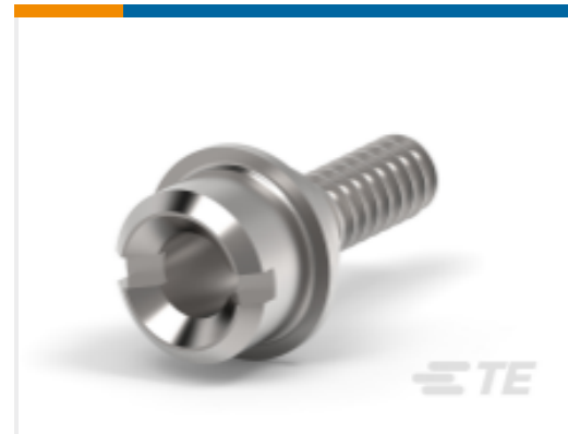
TE 系列/零件编号 786585-3 50SR SCREWLOCK KIT, BULK,FEMAL