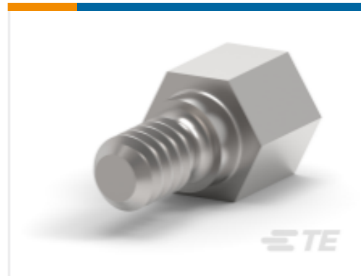
TE 系列/零件编号 749087-3 50SR SCREWLOCK KIT, FEMALE