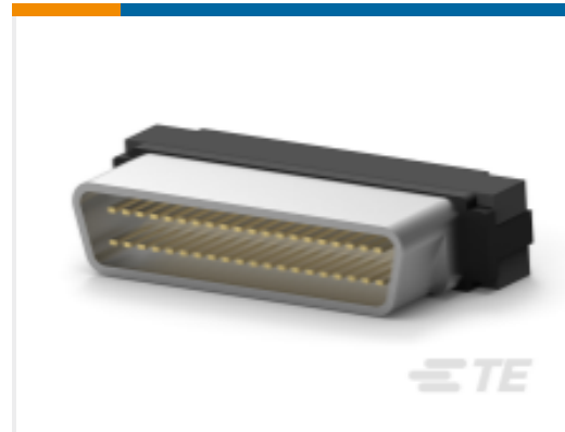
TE 系列/零件编号 5749621-4 40 50S CABLE PLUG CONN/COV KIT