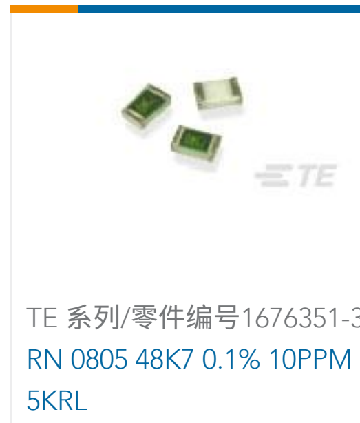
TE 系列/零件编号1676351-3 RN 0805 48K7 0.1% 10PPM 5KRL