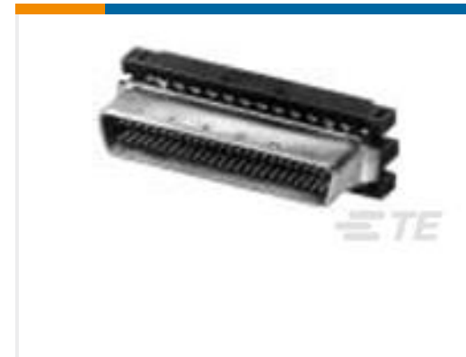
TE 系列/零件编号 5749111-3 40 50SR CABLE PLUG ASSY