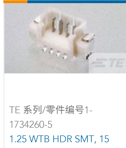
TE 系列/零件编号1- 1734260-5 1.25 WTB HDR SMT, 15 POS