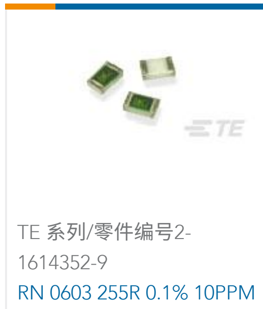
TE 系列/零件编号2- 1614352-9 RN 0603 255R 0.1% 10PPM CUT LENGTH