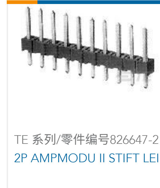
TE 系列/零件编号826647-2 2P AMPMODU II STIFT LEI