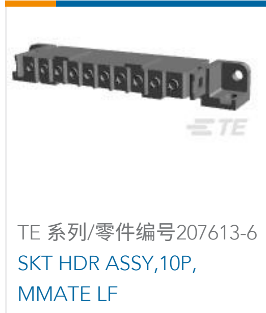
TE 系列/零件编号207613-6 SKT HDR ASSY,10P, MMATE LF