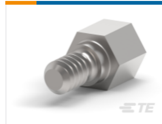
TE 系列/零件编号 749087-2 50SR SCREWLOCK KIT, FEMALE