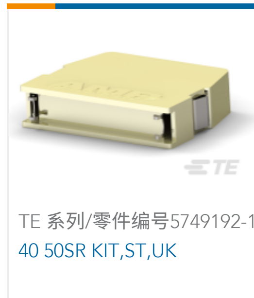
TE 系列/零件编号5749192-1 40 50SR KIT,ST,UK