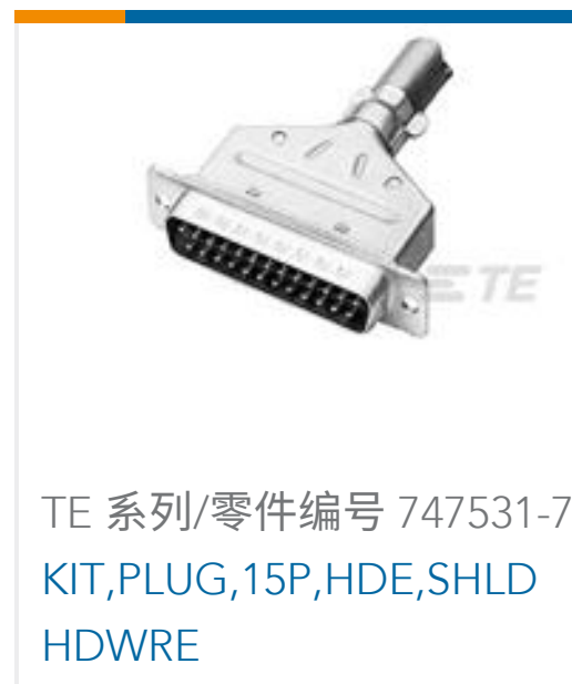
TE 系列/零件编号 747531-7 KIT, PLUG, 15P, HDE, SHLD HDWRE