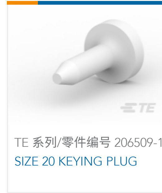
TE 系列/零件编号 206509-1 SIZE 20 KEYING PLUG