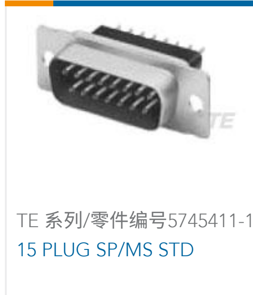
TE 系列/零件编号5745411-1 15 PLUG SP/MS STD