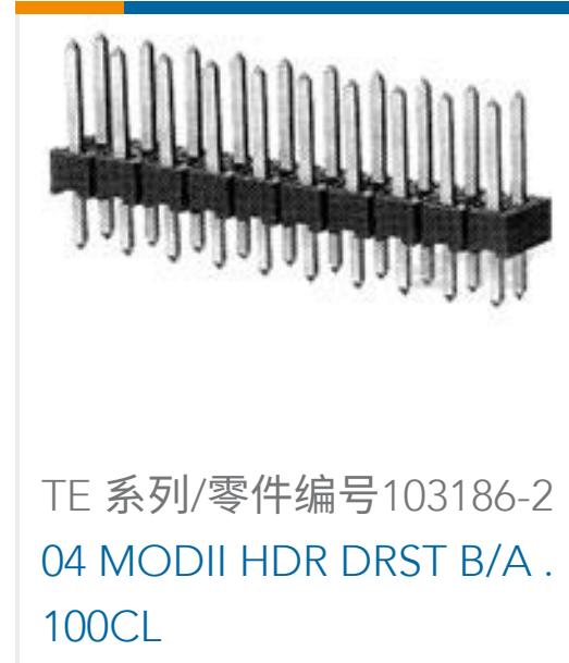
TE 系列/零件编号103186-2 04 MODII HDR DRST B/A . 100CL