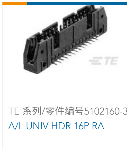
TE 系列/零件编号5102160-3 A/L UNIV HDR 16P RA