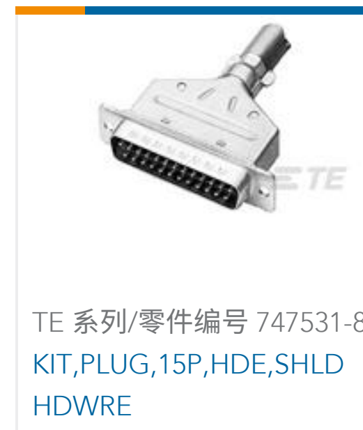
TE 系列/零件编号 747531-8 KIT, PLUG, 15P, HDE, SHLD HDWRE