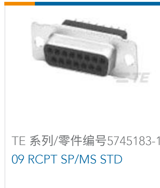
TE 系列/零件编号 5745183-1 09 RCPT SP/MS STD