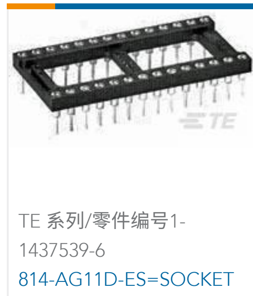
TE 系列/零件编号1- 1437539-6 814-AG11D-ES=SOCKET ASSY