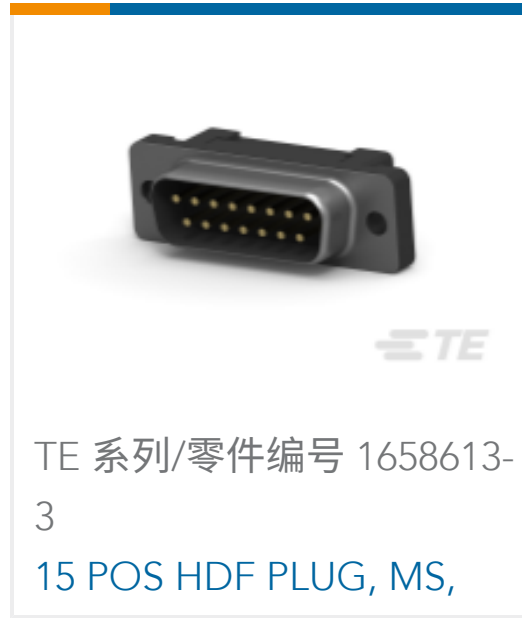
TE 系列/零件编号 1658613-3 15 POS HDF PLUG, MS, LEAD FREE