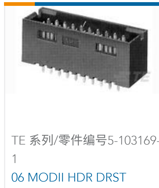
TE 系列/零件编号5-103169- 1 06 MODII HDR DRST SHRD .100CL