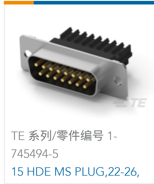
TE 系列/零件编号 1-745494-5 15 HDE MS PLUG, 22-26, LEAD FREE