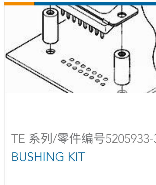
TE 系列/零件编号 5205933-3 BUSHING KIT