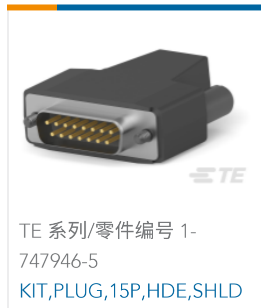
TE 系列/零件编号 1-747946-5 KIT, PLUG, 15P, HDE, SHLD ENCLSRE