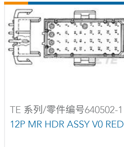
TE 系列/零件编号640502-1 12P MR HDR ASSY V0 RED