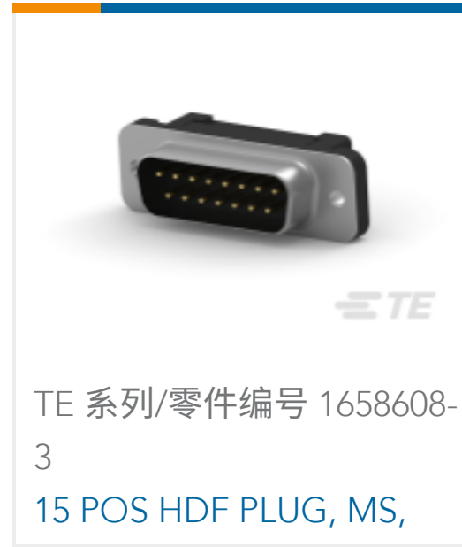
TE 系列/零件编号 1658608-3 15 POS HDF PLUG, MS, LEAD FREE