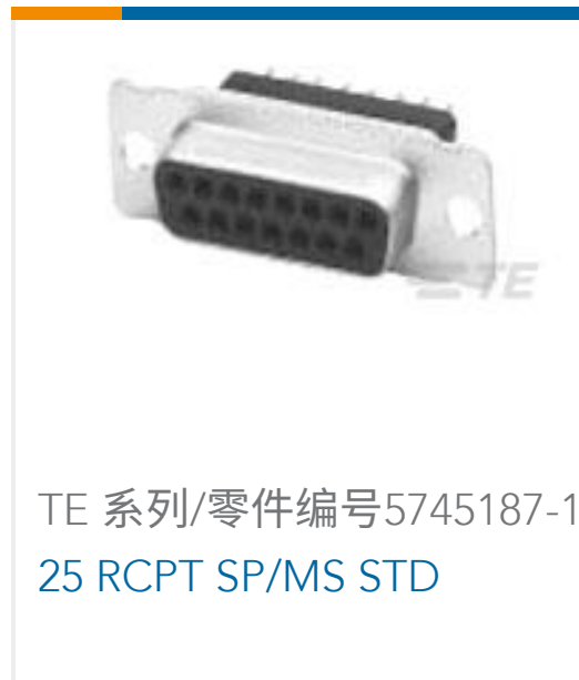
TE 系列/零件编号 5745187-1 25 RCPT SP/MS STD