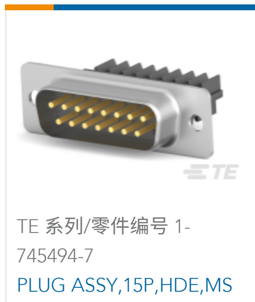
TE 系列/零件编号 1-745494-7 PLUG ASSY, 15P, HDE, MS