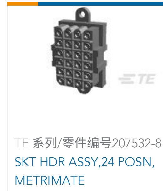
TE 系列/零件编号 207532-8 SKT HDR ASSY, 24 POSN, METRIMATE