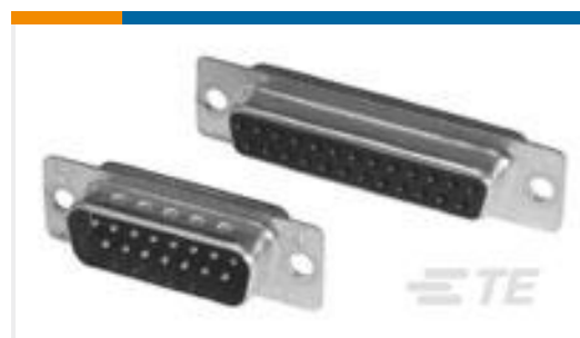
TE 系列/零件编号5-747909-2 15 Rcpt Solder Cup, Gold Flash