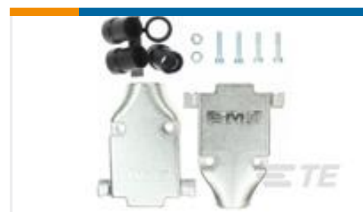
TE 系列/零件编号5748676-2 DIE CAST CBL CLMP KIT, SZ 2