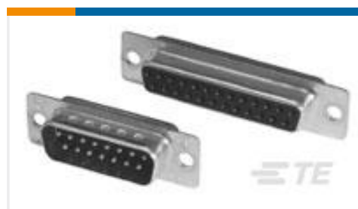
TE 系列/零件编号5-747913-2 25 Rcpt Solder Cup, Gold Flash