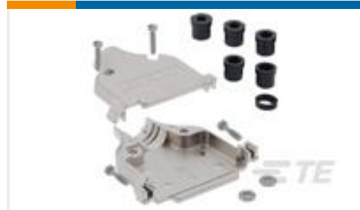
TE 系列/零件编号5748676-3 DIE CAST CBL CLMP KIT, SZ 3