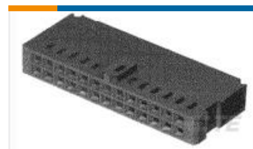
TE 系列/零件编号1-102387-0 50 MODIV HSG COMP DR .100 POL