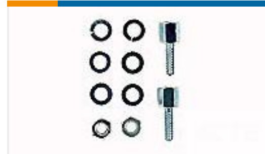
TE 系列/零件编号5205817-3 FEMALE SCREWLOCK KIT