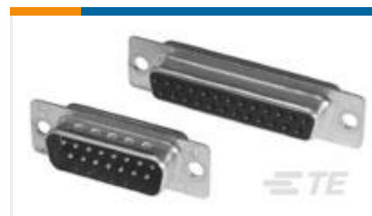
TE 系列/零件编号5-747916-2 37 Plug Solder Cup, Gold Flash