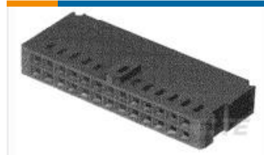
TE 系列/零件编号102387-4 20 MODIV HSG COMP DR .100 POL