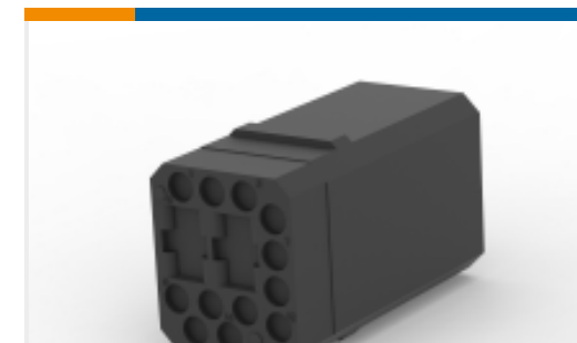
TE 系列/零件编号202760-2 SKT MODULE, 14 POSN, G-SERIES