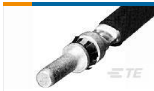
TE 系列/零件编号193837-5 PIN ASSY., CRIMP, 6MM, 4AWF