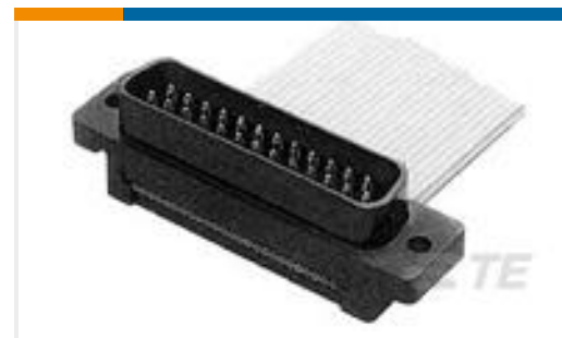
TE 系列/零件编号5746862-4 9 POS HDF PLUG, MS