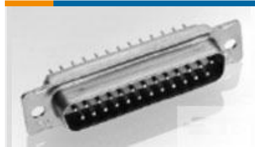
TE 系列/零件编号204502-4 RECEPT ASSY, 26 POSN, AMPLIMITE