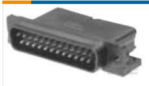
TE 系列/零件编号5747470-2 HD-20 PLUG 37P RA 590