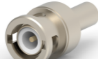
TE 系列/零件编号 5-1634500-2 BNC Str Plg Hex 50Ohm Nickel Pltd RG58C/