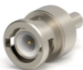
TE 系列/零件编号 5-1634500-0 BNC Str Plg Hex 50Ohm Nickel Plated RG17