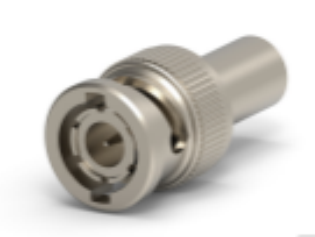
TE 系列/零件编号 2-5221128-7 PLUG,COMMERCIAL BNC