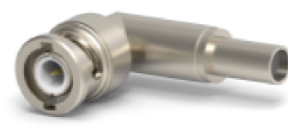
TE 系列/零件编号 5413959-1 PLUG RTANG BNC HEX 50 OHM