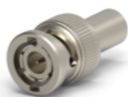
TE 系列/零件编号 2-5221128-1 PLUG,COMMERCIAL BNC