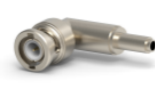
TE 系列/零件编号 5413959-3 BNC HEX RT ANG PLUG 50 OHM