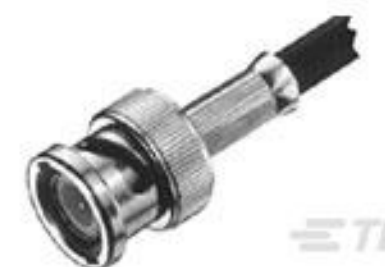
TE 系列/零件编号 2-5221128-3 PLUG,COMMERCIAL BNC