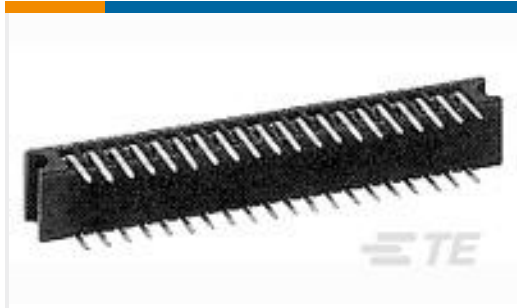
TE 系列/零件编号5-533009- 8 50 MODII 2PC CE RCPT ASSY, RoHS