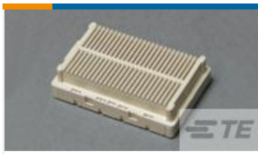
TE 系列/零件编号1761613-5 STEP-Z RCPT 05MM 104P PB ST