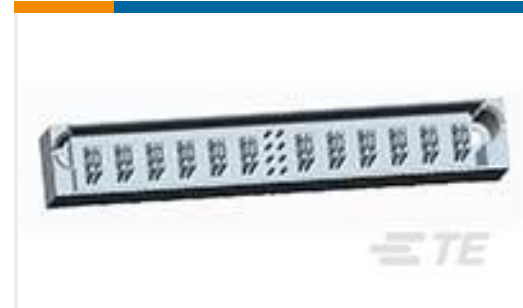
TE 系列/零件编号6450823-1 VERTICAL HEADER W/ SHORT 4HDP