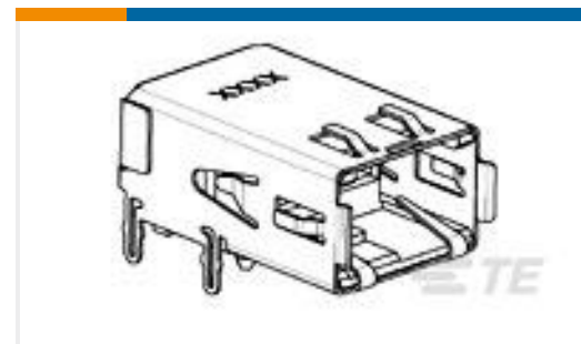
TE 系列/零件编号1888372-1 RECPT,HSSDC2,FIBRE,ON TAPE