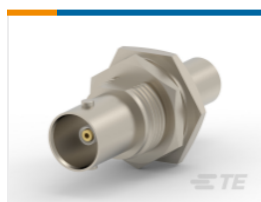
TE 系列/零件编号 5-1634516-1 BNC RM BHJ Hex 50Ohm Nickel Pltd RG58C/U