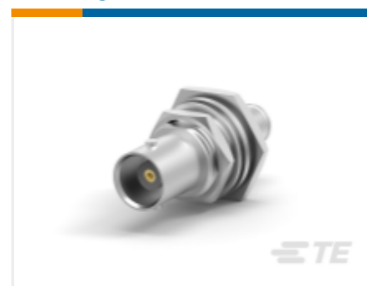
TE 系列/零件编号 5228980-5 JACK, BULKHEAD, COM'L, BNC