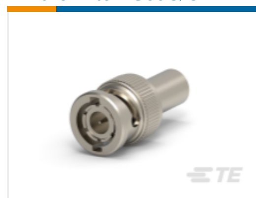
TE 系列/零件编号 1-5221128-0 PLUG, COMMERCIAL BNC