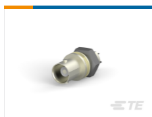
TE 系列/零件编号 5227726-3 ISOLATED BNC SOLDER JACK ASSY