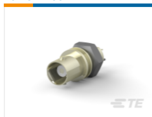
TE 系列/零件编号 5227726-2 ISOLATED BNC SOLDER JACK ASSY