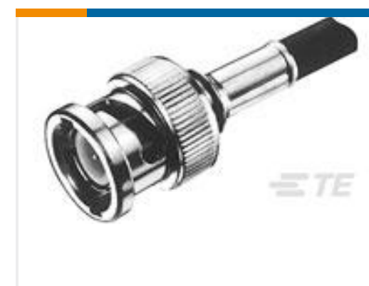
TE 系列/零件编号 5227079-6 COMM. BNC-PLUG