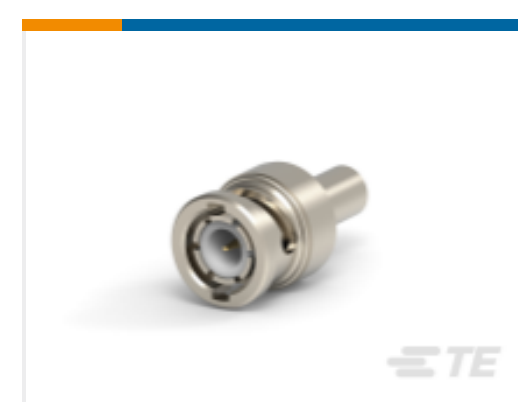
TE 系列/零件编号 5227079-5 COMM BNC PLUG