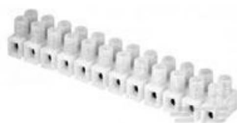
TE 系列/零件编号1776294-2 TSB23002=EUROPA TERM BLK,8MM