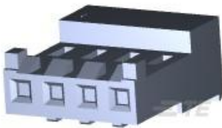
TE 系列/零件编号3-644663-4 04P MTA156 CONN ASSY 20AWG LF