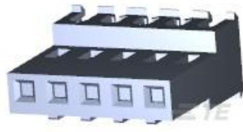
TE 系列/零件编号3-640604-5 05P MTA156 CONN ASSY 18AWG LF