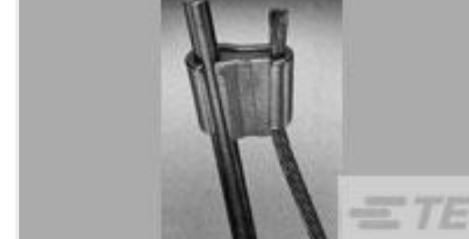
TE 系列/零件编号66331-2 III+ SKT,24-20,30AU>10, STRIP