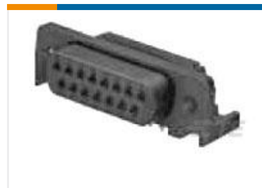
TE 系列/零件编号745395-2 09 APFL RCPT RA 318 (SL)