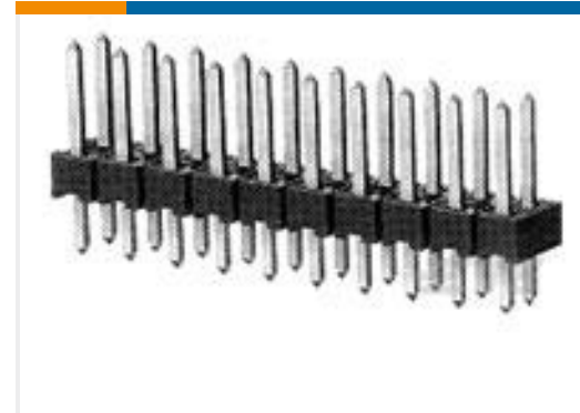
TE 系列/零件编号5-146256-8 16 MODII HDR DRST B/A . 100CL L