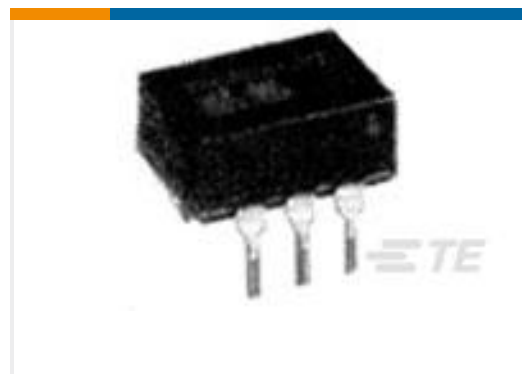
TE 系列/零件编号5-1437581-6 ASF22=DPDT AUTO-SLIDE