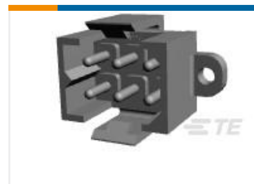
TE 系列/零件编号1-207158-0 METRIMATE PIN HDR ASY, 6P LF