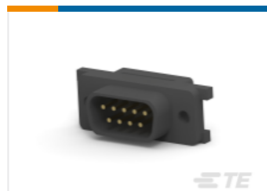
TE 系列/零件编号 1658611-4 09 POS HDF PLUG, AP, LEAD FREE