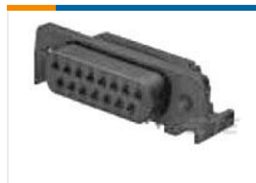
TE 系列/零件编号5745396-2 HD-20 RCPT 15P RA 318 FFSCRLK