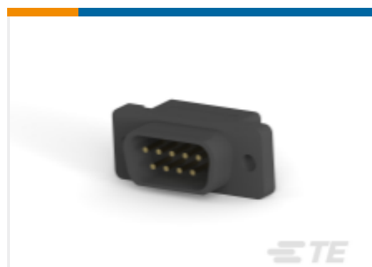
TE 系列/零件编号 1658615-4 09 POS HDF PLUG, AP, LEAD FREE