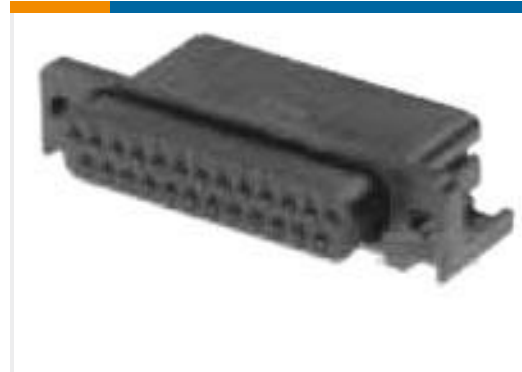
TE 系列/零件编号5747461-5 HD-20 RCPT 25P RA 590 FFSCRLK