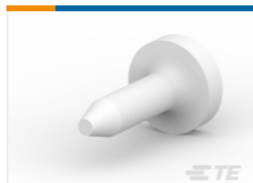
TE 系列/零件编号 206509-1 SIZE 20 KEYING PLUG