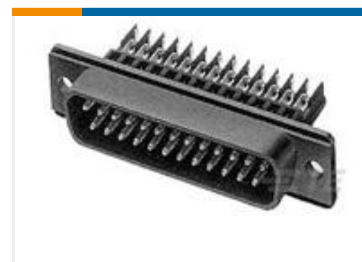
TE 系列/零件编号 745203-9 09 HDE AP PLUG, LEAD FREE