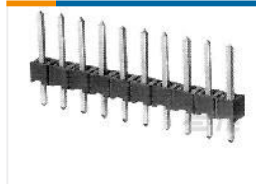
TE 系列/零件编号102976-3 03 MODII HDR SRST B/A . 100CL