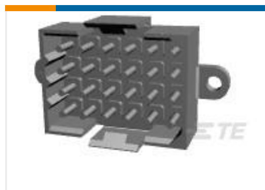
TE 系列/零件编号1-206763-3 METRIMATE PIN HEADER ASSY,24P