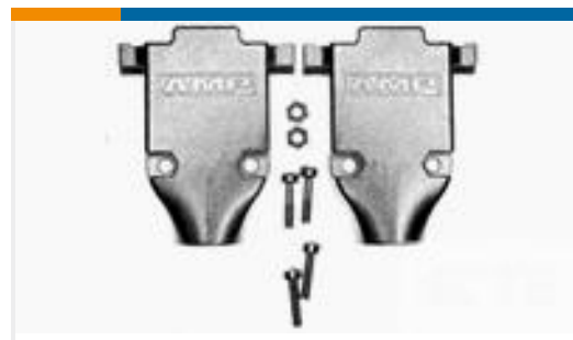
TE 系列/零件编号5745175-6 CABLE CLAMP KIT,SZ 5