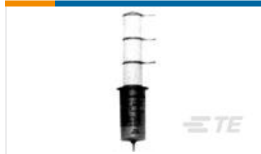
TE 系列/零件编号2-1618240-6 K43C332=RELAY, VACUUM, SPDT