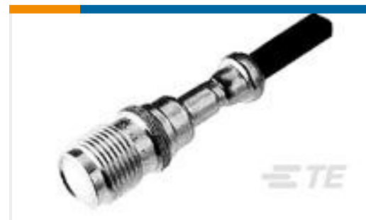
TE 系列/零件编号225551-6 TNC JACK DUAL W/P