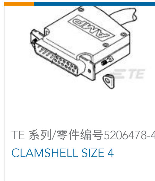
TE 系列/零件编号5206478-4 CLAMSHELL SIZE 4