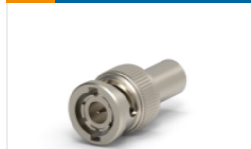
TE 系列/零件编号 1-5221128-0 PLUG,COMMERCIAL BNC