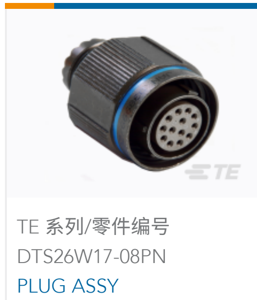
TE 系列/零件编号 DTS26W17-08PN PLUG ASSY