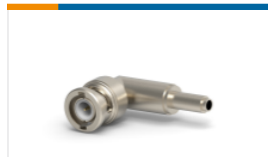
TE 系列/零件编号 5413959-3 BNC HEX RT ANG PLUG 50 OHM