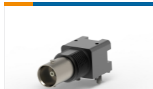
TE 系列/零件编号 5413194-2 BNC, RT ANG, PCB, JACK