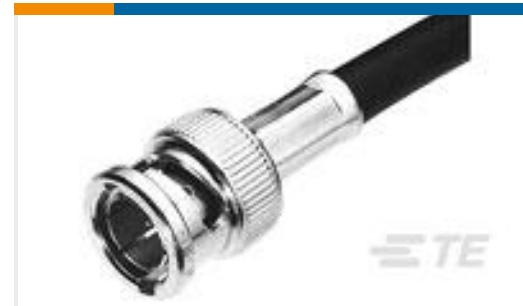
TE 系列/零件编号 5413589-7 KIT,PLUG,COML BNC,HEX CRP