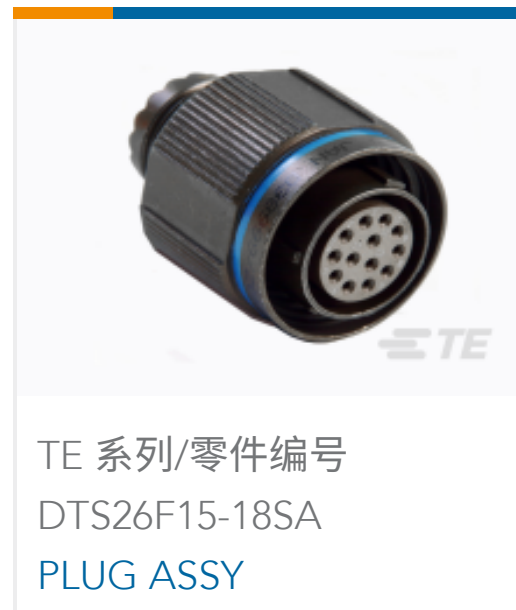
TE 系列/零件编号 DTS26F15-18SA PLUG ASSY