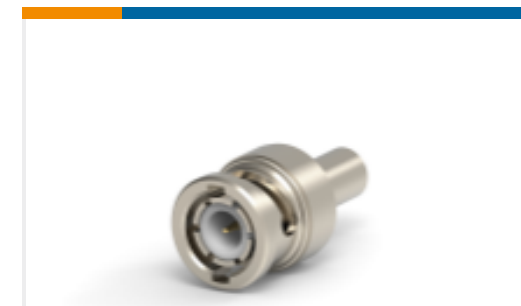
TE 系列/零件编号 5227079-5 COMM BNC PLUG