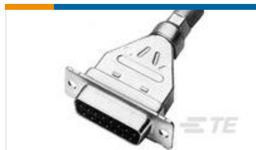
TE 系列/零件编号 1658662-1 KIT,HDP-20,OVRMLD, RCPT,SIZE 3,