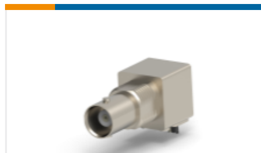
TE 系列/零件编号 5222092-3 JACK,RTANG,PCB,75 OHM,BNC