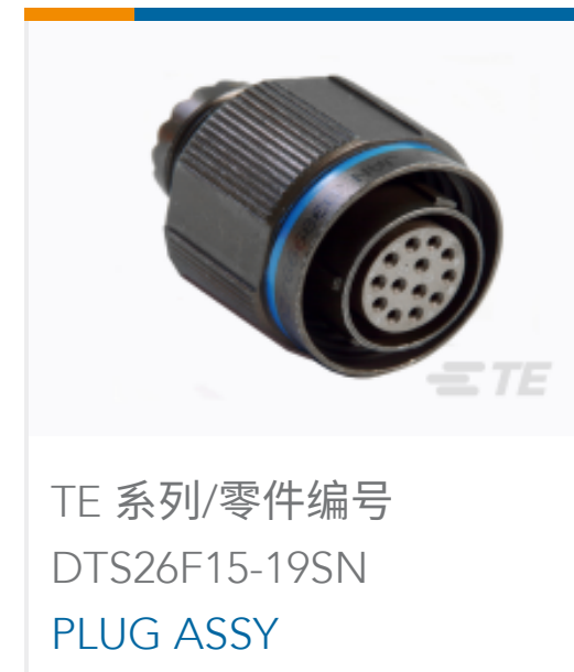
TE 系列/零件编号 DTS26F15-19SN PLUG ASSY