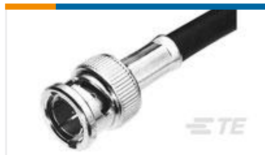
TE 系列/零件编号 5413589-3 KIT,PLUG,COML BNC,HEX CRP