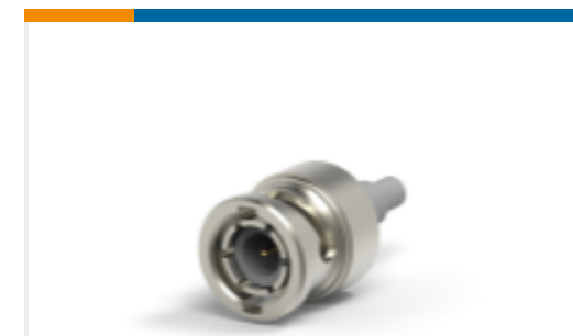
TE 系列/零件编号 1-5227079-6 COMM BNC PLUG