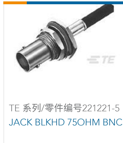
TE 系列/零件编号221221-5 JACK BLKHD 75OHM BNC