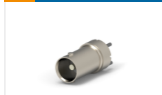
TE 系列/零件编号 6274291-2 JACK,VERT,PCB,75OHM, BNC