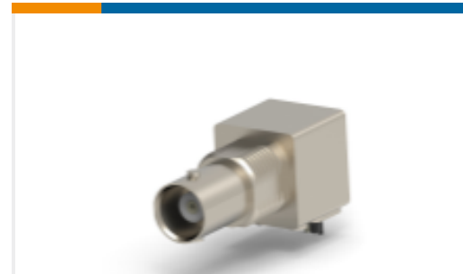
TE 系列/零件编号 5222092-1 JACK,RTANG,PCB,75 OHM,BNC