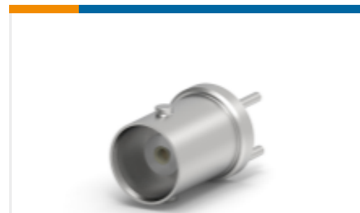
TE 系列/零件编号 5-1634503-3 BNC Str PCB Skt 75Ohm Nickel Pltd