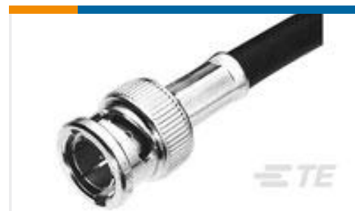
TE 系列/零件编号 5221185-8 PLUG,75 OHM, COMMERCIAL BNC