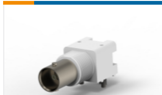
TE 系列/零件编号 5413194-1 BNC, RT ANG, PCB, JACK