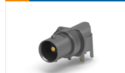
TE 系列/零件编号 6274425-2 JACK,R/A,PCB,75 OHM, BNC