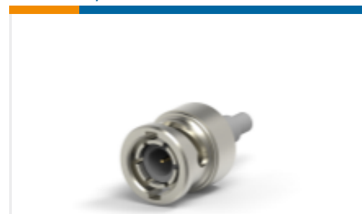
TE 系列/零件编号 8-5227079-2 COMM BNC PLUG