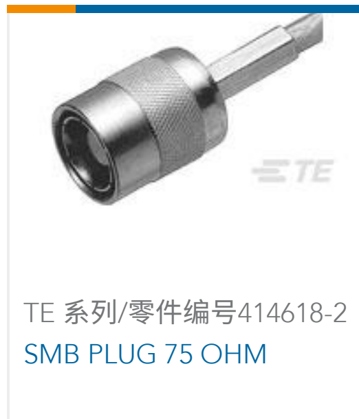
TE 系列/零件编号414618-2 SMB PLUG 75 OHM