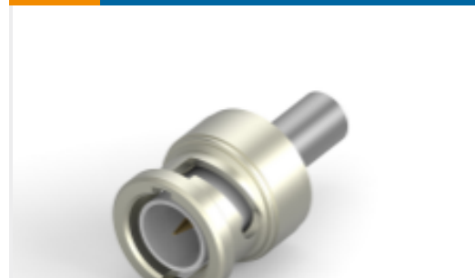
TE 系列/零件编号 5221185-2 PLUG,75 OHM,COML BNC