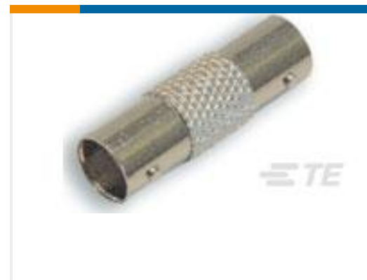
TE 系列/零件编号1-1478041-0 BNC Str Adp JJ 75Ohm Silver Pltd