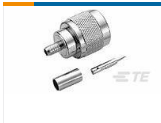
TE 系列/零件编号1-1337410-0 N Str Plg Hex 50Ohm Silver Pltd PSF 1/4M