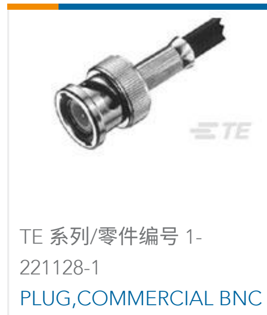
TE 系列/零件编号 1-221128-1 PLUG,COMMERCIAL BNC