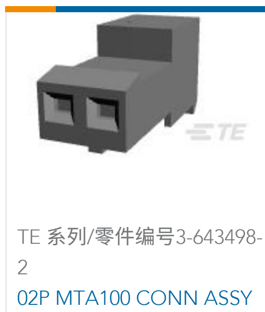
TE 系列/零件编号 3-643498-2 02P MTA100 CONN ASSY LF