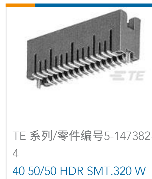
TE 系列/零件编号 5-147382-4 40 50/50 HDR SMT.320 W /HD SN