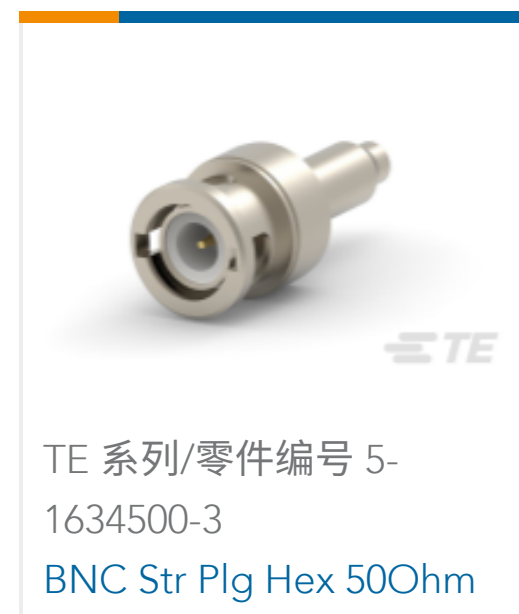
TE 系列/零件编号 5-1634500-3 BNC Str Plg Hex 50Ohm Nickel Pltd RG58C/