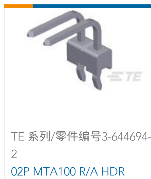
TE 系列/零件编号 3-644694-2 02P MTA100 R/A HDR RETENTIVE