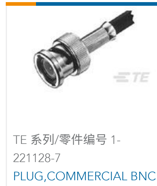
TE 系列/零件编号 1-221128-7 PLUG,COMMERCIAL BNC