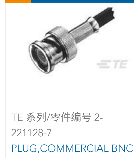
TE 系列/零件编号 2-221128-7 PLUG,COMMERCIAL BNC