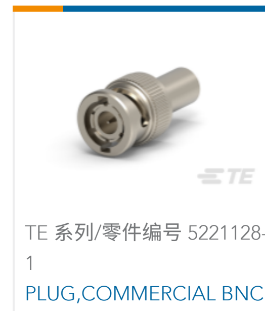
TE 系列/零件编号 5221128-1 PLUG,COMMERCIAL BNC