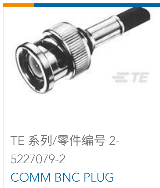
TE 系列/零件编号 2-5227079-2 COMM BNC PLUG