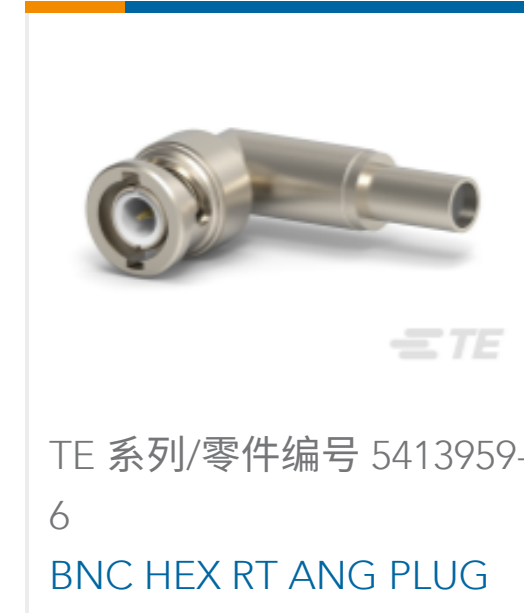
TE 系列/零件编号 5413959-6 BNC HEX RT ANG PLUG 50 OHM