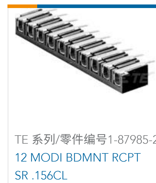
TE 系列/零件编号 1-87985-2 12 MODI BDMNT RCPT SR .156CL