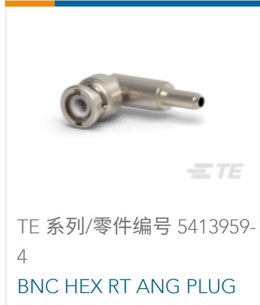
TE 系列/零件编号 5413959-4 BNC HEX RT ANG PLUG 50 OHM