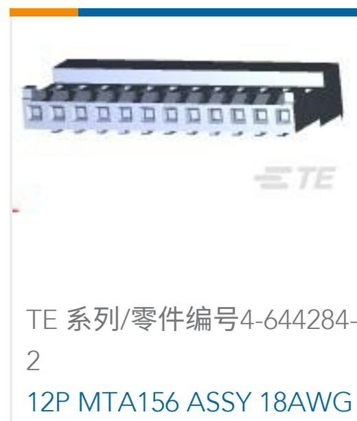
TE 系列/零件编号 4-644284-2 12P MTA156 ASSY 18AWG ORA LF