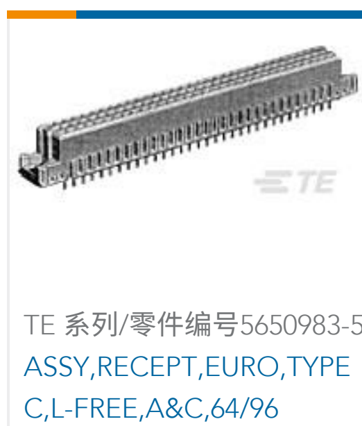
TE 系列/零件编号 5650983-5 ASSY,RECEPT,EURO,TYPE C,L-FREE,A&C,64/96