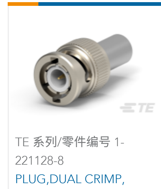
TE 系列/零件编号 1-221128-8 PLUG,DUAL CRIMP, COMMERCIAL,BNC