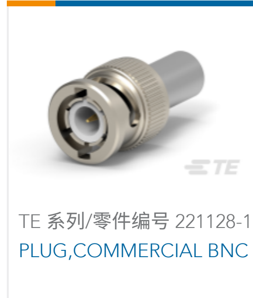
TE 系列/零件编号 221128-1 PLUG,COMMERCIAL BNC