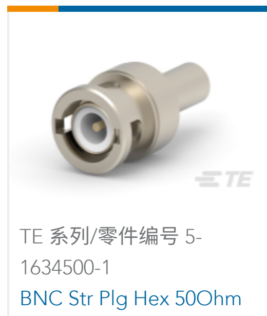
TE 系列/零件编号 5-1634500-1 BNC Str Plg Hex 50Ohm Nickel Plated RG17