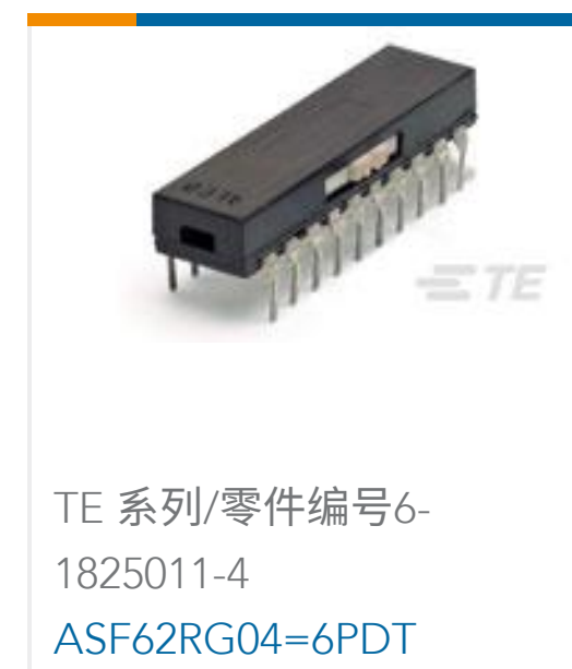
TE 系列/零件编号 6-1825011-4 ASF62RG04=6PDT AUTOSLIDE