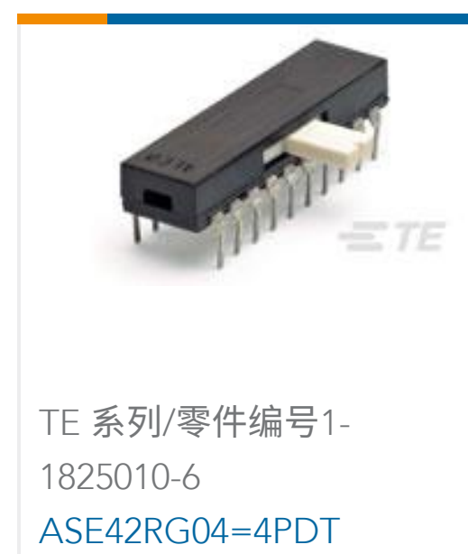
TE 系列/零件编号 1-1825010-6 ASE42RG04=4PDT AUTOSLIDE