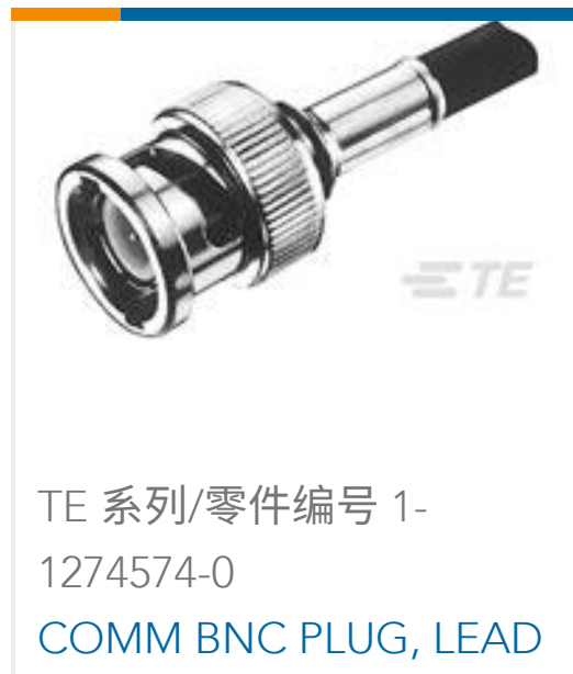
TE 系列/零件编号 1-1274574-0 COMM BNC PLUG, LEAD FREE