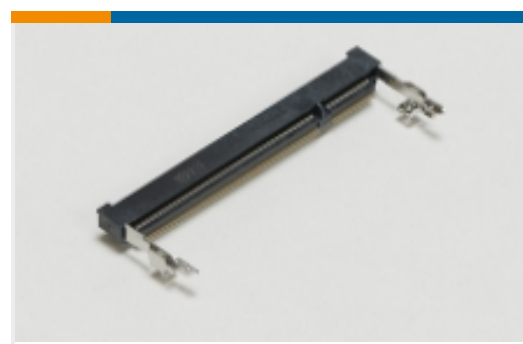
SO DIMM 插槽(14)