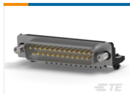
TE 系列/零件编号 5747842-6 25 MSFL PLUG RA 318 (SL, FM,BL)