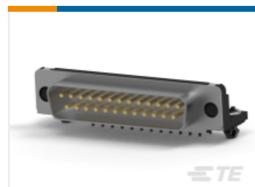
TE 系列/零件编号 5747842-4 25 MSFL PLUG RA 318 (IN, FM,BL)