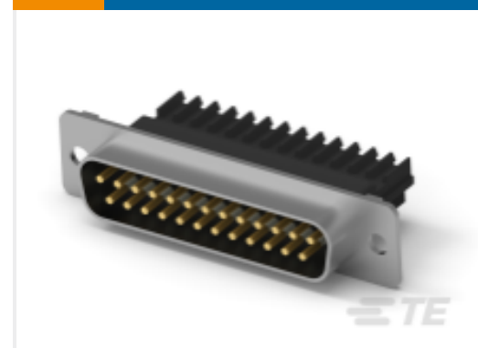
TE 系列/零件编号 1-745496-8 25 HDE MS PLUG,22-26, LEAD FREE