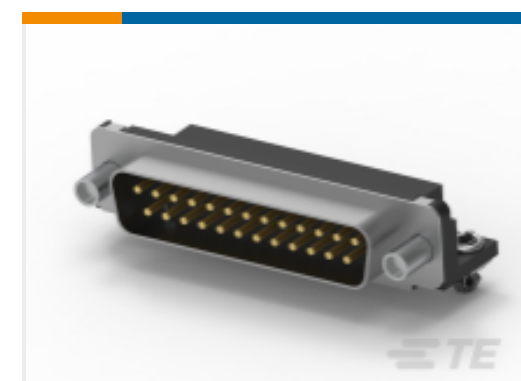
TE 系列/零件编号 5747842-5 25 MSFL PLUG RA 318 (SL, FM,BL)