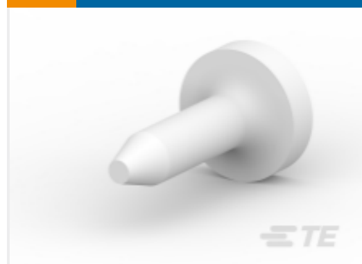
TE 系列/零件编号 206509-1 SIZE 20 KEYING PLUG