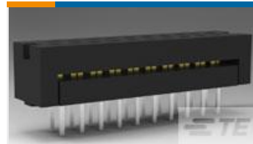
TE 系列/零件编号746610-2 014 DIP PLUG 100CL TIN