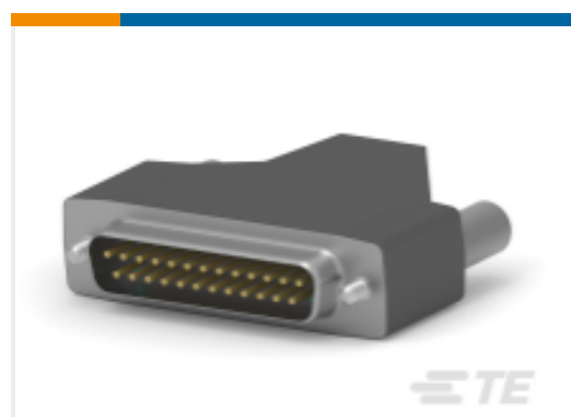
TE 系列/零件编号 1-747948-8 KIT,PLUG,25P,HDE,SHLD ENCLSRE