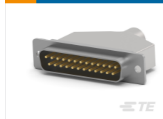
TE 系列/零件编号 1-747547-0 KIT,PLUG,25P,HDE,SHLD HDWRE