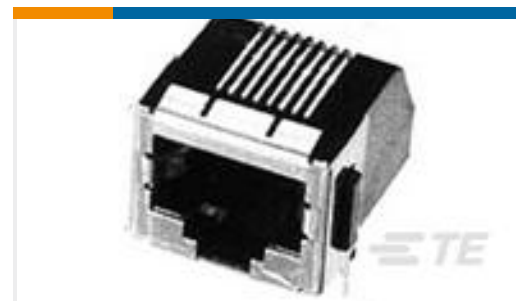
TE 系列/零件编号5406429-1 MJ,LPF,R/A,8P,SHLD,PNL STP,HTN