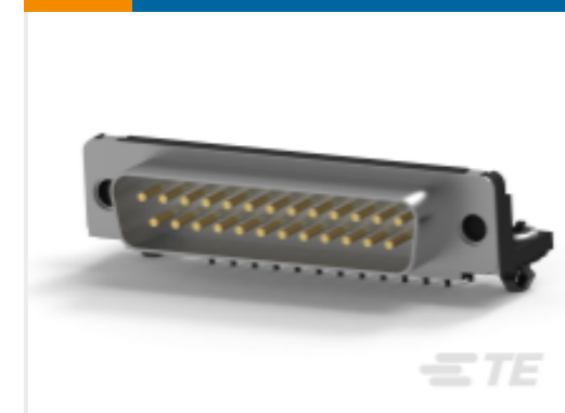
TE 系列/零件编号 5747842-2 25 MSFL PLUG RA 318 (FM, BL)