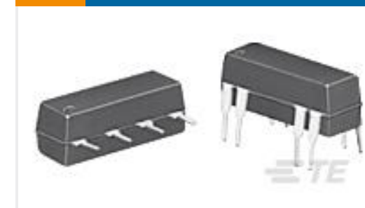
TE 系列/零件编号2- 1393771-4 JWD-172-159=REED RELAYS