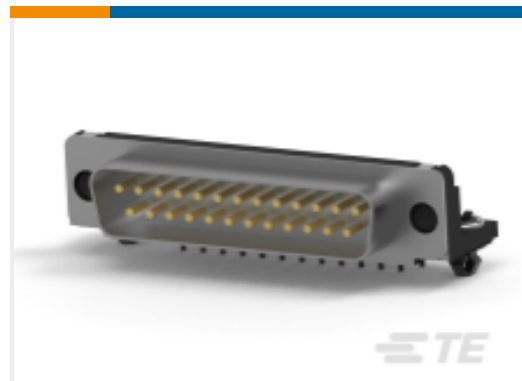
TE 系列/零件编号 5747842-3 25 MSFL PLUG RA 318 (IN, FM,BL)