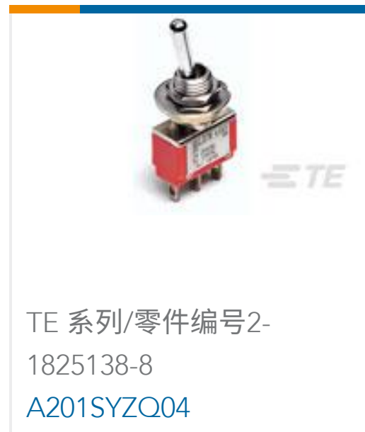
TE 系列/零件编号2- 1825138-8 A201SYZQ04