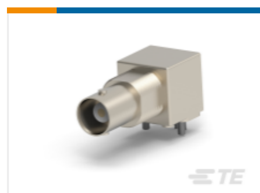
TE 系列/零件编号 1-1337494-0 BNC R/A Shld PCB Skt 50Ohm Nickel Pltd