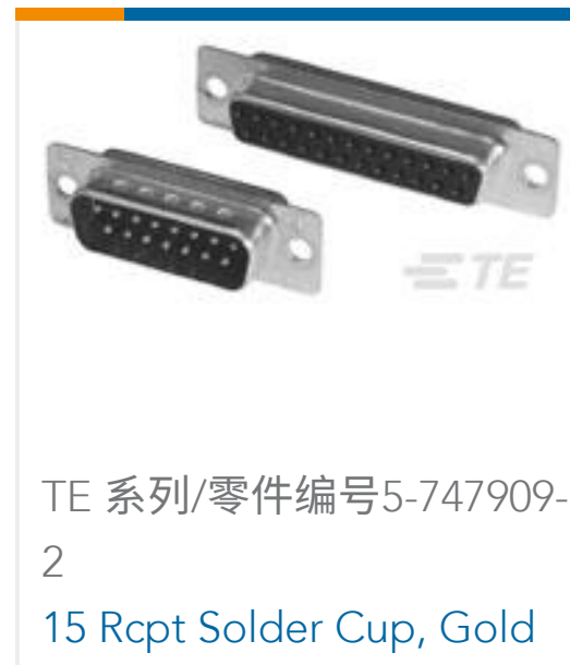
TE 系列/零件编号5-747909- 2 15 Rcpt Solder Cup, Gold Flash