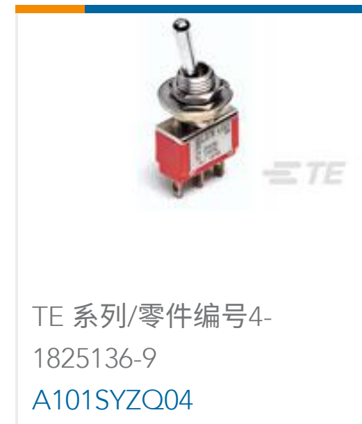
TE 系列/零件编号4- 1825136-9 A101SYZQ04