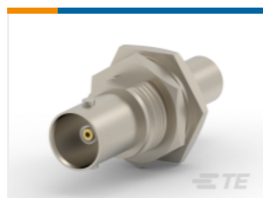
TE 系列/零件编号 5-1634516-1 BNC RM BHJ Hex 50Ohm Nickel Pltd RG58C/U