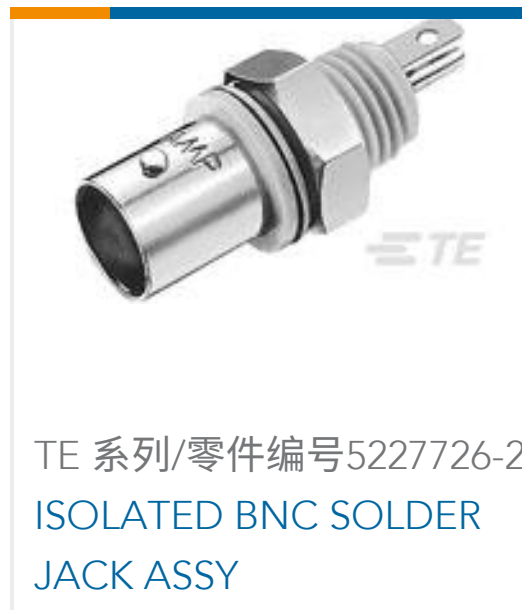
TE 系列/零件编号5227726-2 ISOLATED BNC SOLDER JACK ASSY