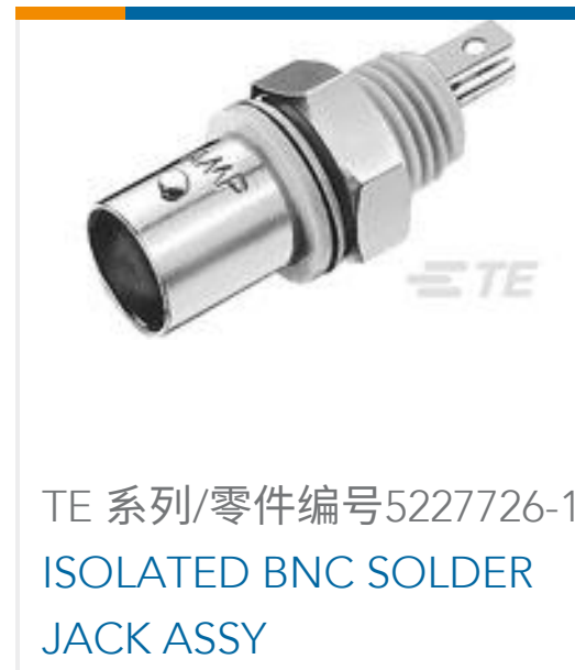
TE 系列/零件编号5227726-1 ISOLATED BNC SOLDER JACK ASSY