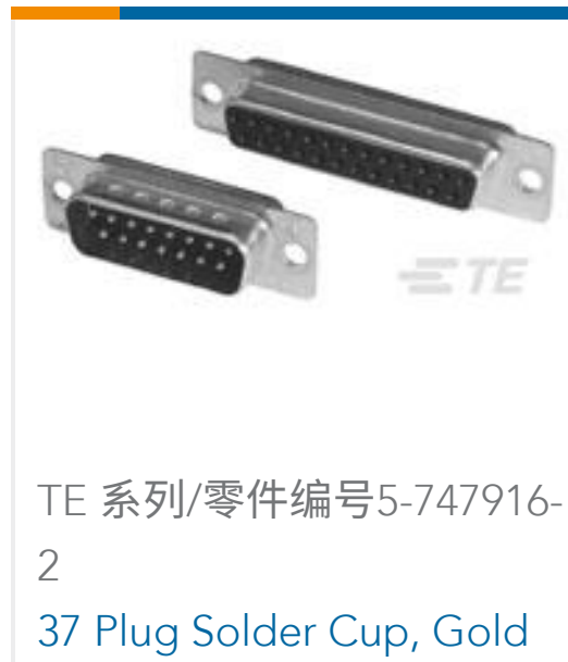
TE 系列/零件编号5-747916- 2 37 Plug Solder Cup, Gold Flash