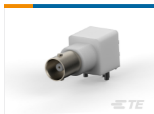
TE 系列/零件编号 1-1337543-0 BNC Ins R/A PCB Skt 50Ohm White