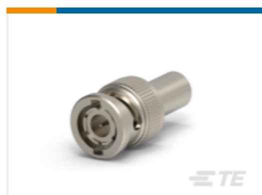
TE 系列/零件编号 2-5221128-1 PLUG,COMMERCIAL BNC