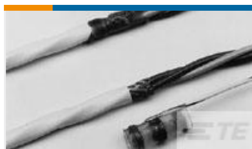
TE 系列/零件编号 762712N001 S02-20-RCS453