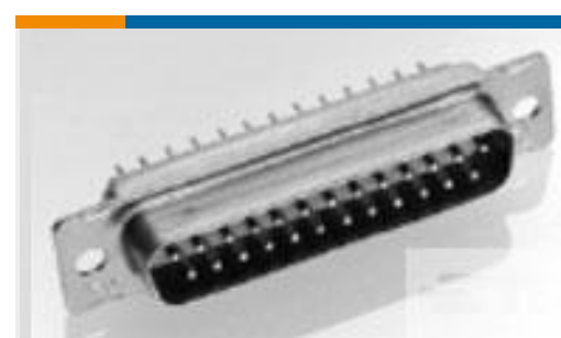
TE 系列/零件编号205558-3 AMPLIMITE,ASY,PLUG, STD,109,2,KIT