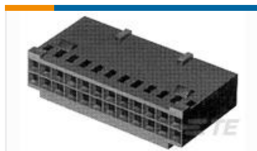
TE 系列/零件编号5-87631-2 60 MODIV HSG DR MRKD . 100 POL