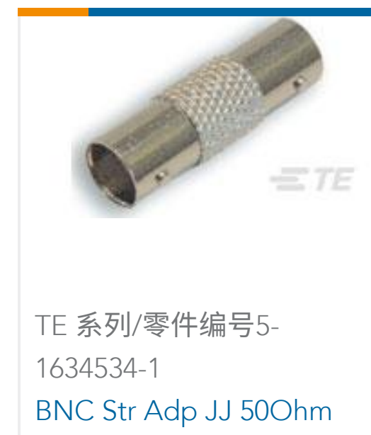
TE 系列/零件编号5- 1634534-1 BNC Str Adp JJ 50Ohm Nickel Pltd