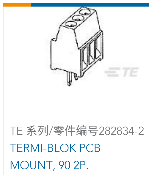
TE 系列/零件编号282834-2 TERMI-BLOK PCB MOUNT, 90 2P.