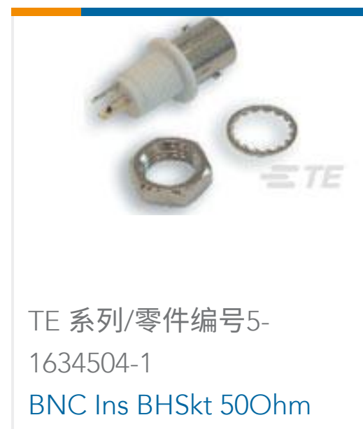
TE 系列/零件编号5- 1634504-1 BNC Ins BHSkt 50Ohm Nickel Gold Pltd