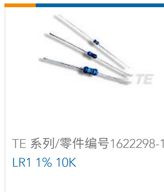
TE 系列/零件编号1622298-1 LR1 1% 10K