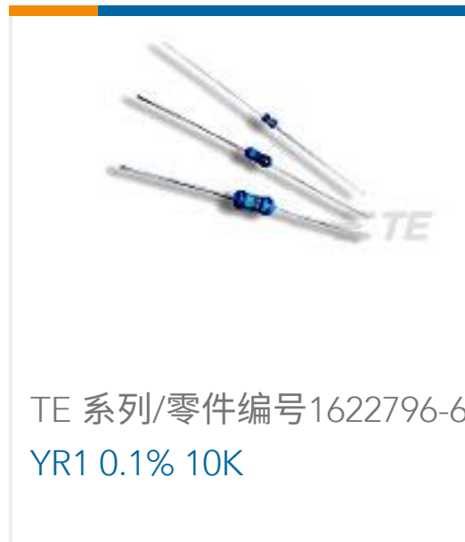
TE 系列/零件编号1622796-6 YR1 0.1% 10K