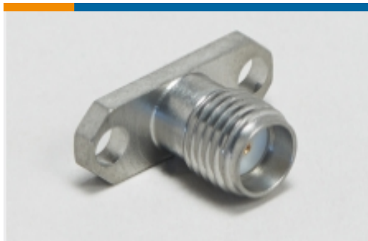
射频连接器发射器(3)