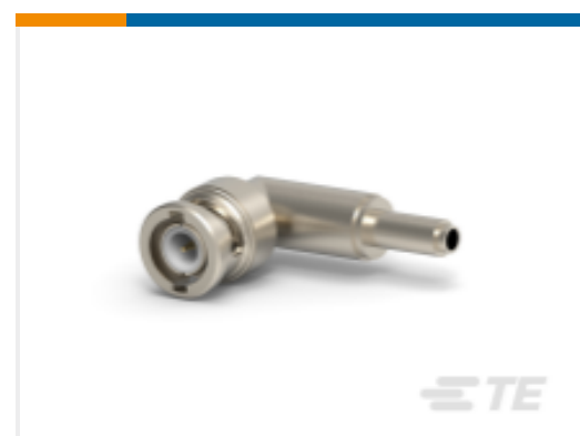
TE 系列/零件编号 5413959-3 BNC HEX RT ANG PLUG 50 OHM