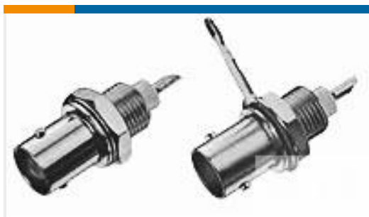
TE 系列/零件编号227715-3 BNC SOLDER RECEIPT JACK