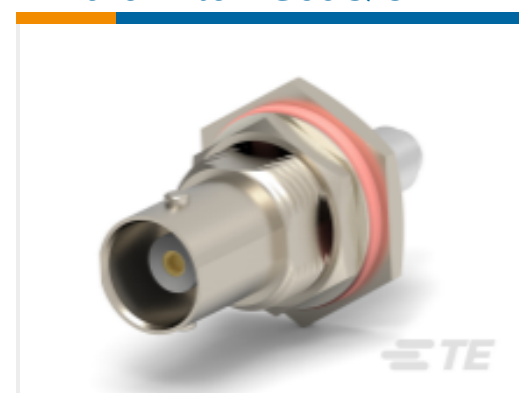
TE 系列/零件编号 5413771-3 JACK BLKHD,COML BNC, HEX CRIMP