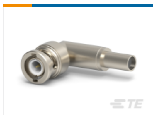
TE 系列/零件编号 5413959-1 PLUG RTANG BNC HEX 50 OHM