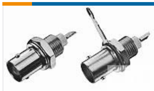
TE 系列/零件编号227755-1 BNC SOLDER RECEIPT JACK SHORT