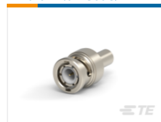
TE 系列/零件编号 5227079-5 COMM BNC PLUG