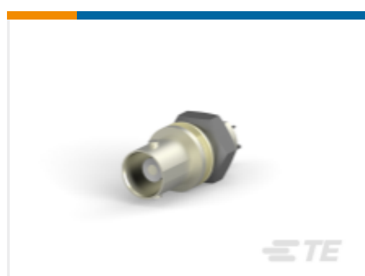
TE 系列/零件编号 5227726-3 ISOLATED BNC SOLDER JACK ASSY