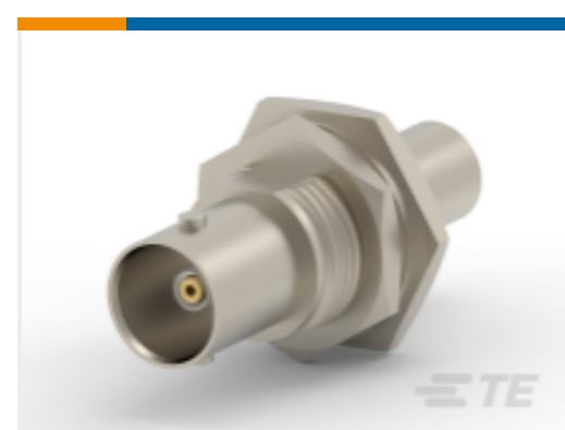
TE 系列/零件编号 5-1634516-1 BNC RM BHJ Hex 50Ohm Nickel Pltd RG58C/U