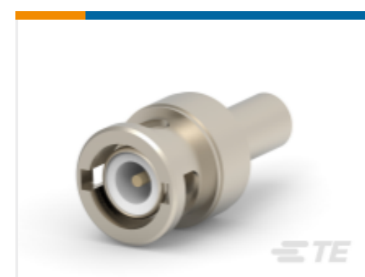
TE 系列/零件编号 5-1634500-2 BNC Str Plg Hex 50Ohm Nickel Pltd RG58C/