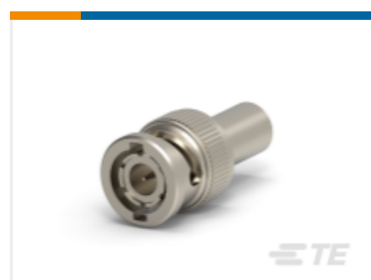
TE 系列/零件编号 2-5221128-1 PLUG,COMMERCIAL BNC