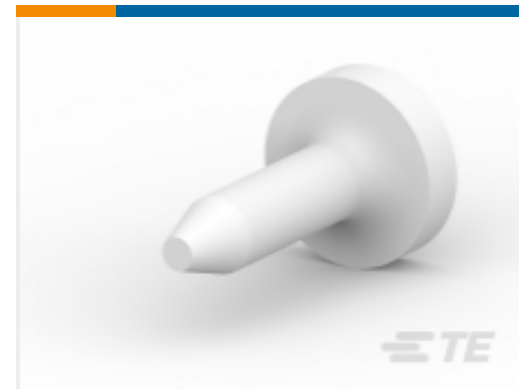
TE 系列/零件编号 206509-1 SIZE 20 KEYING PLUG