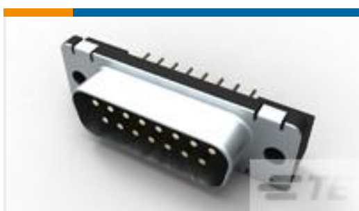
TE 系列/零件编号5747872-8 15 PLUG SP/FMS INSRT