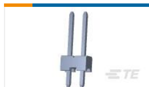
TE 系列/零件编号3-644456-2 02P MTA100 HDR ASSY (NARROW)