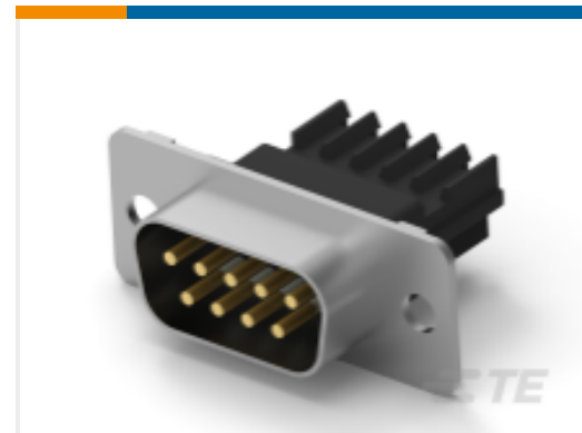
TE 系列/零件编号 2-745492-0 PLUG ASSY,9P,HDE,MS