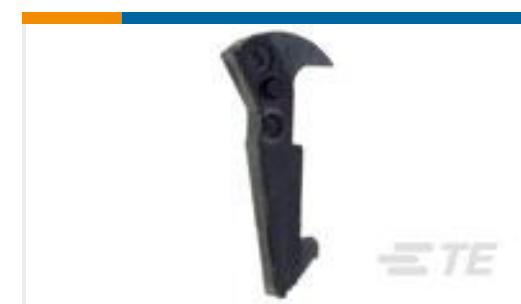
TE 系列/零件编号102320-1 UNIVERSAL HEADER LATCH