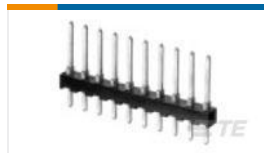
TE 系列/零件编号87220-2 02 MODII HDR SRST UNSHRD .100