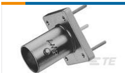
TE 系列/零件编号5227699-1 BNC PCB VERTICAL