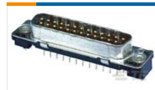
TE 系列/零件编号5747871-8 09 PLUG SP/FMS INSRT