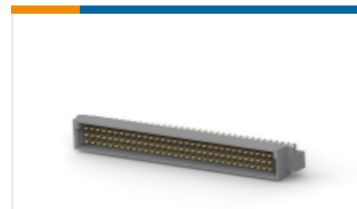
TE 系列/零件编号650473-5 09% EURO TYPE C PIN ST ASSY