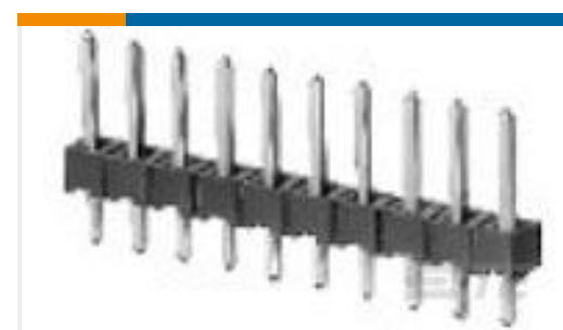
TE 系列/零件编号5-146280-2 02 MODII HDR SRST B/A .100CL