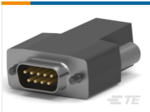
TE 系列/零件编号 1-747944-6 KIT,PLUG,9P,HDE,SHLD ENCLSRE