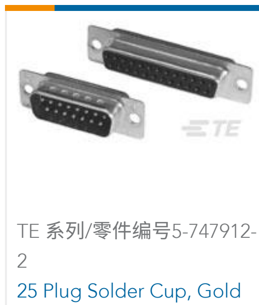
TE 系列/零件编号5-747912- 2 25 Plug Solder Cup, Gold Flash