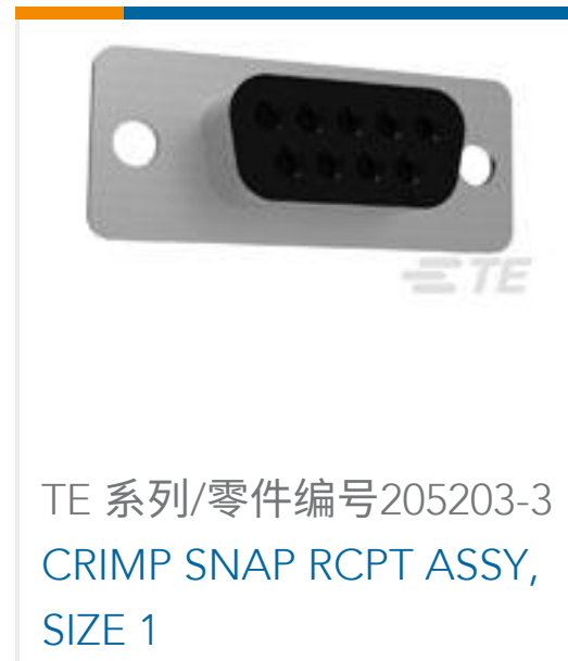
TE 系列/零件编号205203-3 CRIMP SNAP RCPT ASSY, SIZE 1