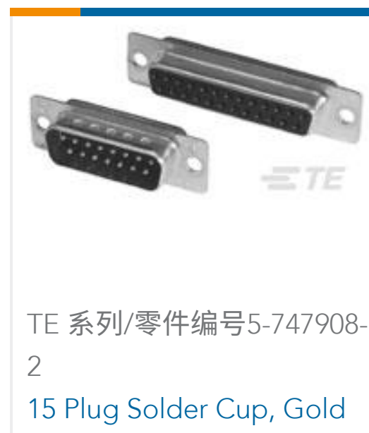
TE 系列/零件编号5-747908- 2 15 Plug Solder Cup, Gold Flash