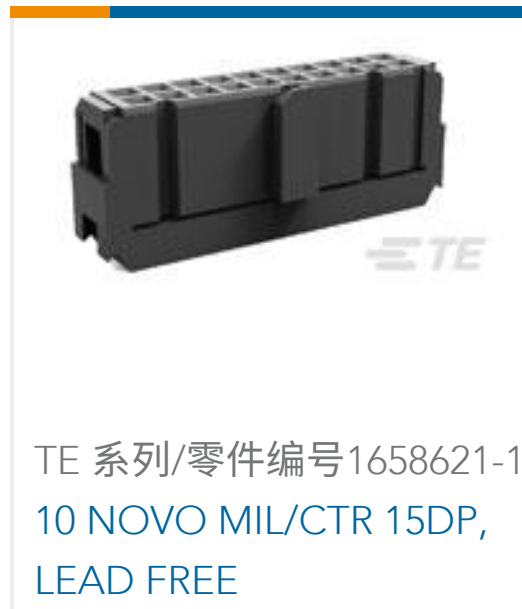
TE 系列/零件编号1658621-1 10 NOVO MIL/CTR 15DP, LEAD FREE