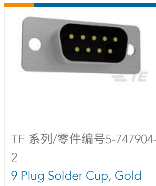
TE 系列/零件编号5-747904- 2 9 Plug Solder Cup, Gold Flash,