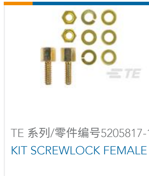
TE 系列/零件编号5205817-1 KIT SCREWLOCK FEMALE