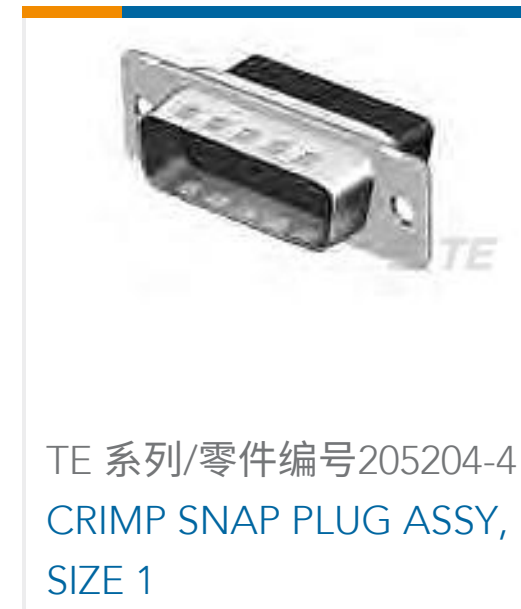
TE 系列/零件编号205204-4 CRIMP SNAP PLUG ASSY, SIZE 1