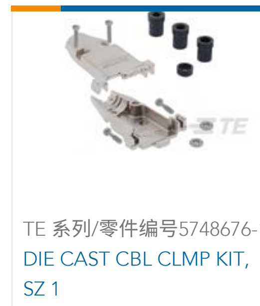
TE 系列/零件编号5748676-1 DIE CAST CBL CLMP KIT, SZ 1