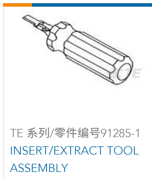
TE 系列/零件编号91285-1 INSERT/EXTRACT TOOL ASSEMBLY