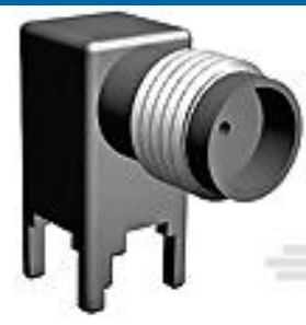
TE 系列/零件编号5-1814400-1 SMA R/A PCB Skt GZD