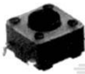
TE 系列/零件编号4-1437565-1 FSM4JSMA=SMT,TACTILE, PB SWITCH