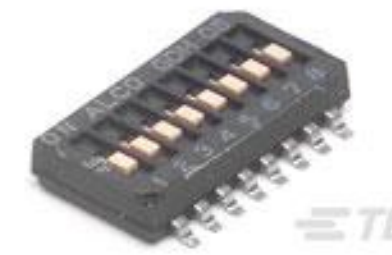
TE 系列/零件编号1571983-4 GDH04S04=DIP SWITCH