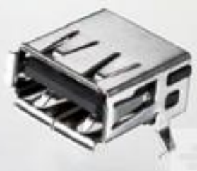
TE 系列/零件编号292303-1 Std USB Type A, R/A, T/H