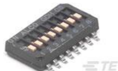
TE 系列/零件编号1571983-1 GDH02S04=DIP SWITCH