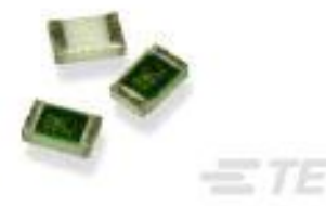
TE 系列/零件编号1-1879417-9 CPF 0603 1M0 0.1% 25PPM 1K RL