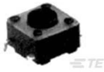
TE 系列/零件编号4-1437565-2 FSM4JSMATR=TACT SWITCH 6X6MIL