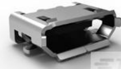
TE 系列/零件编号1981568-1 MICRO USB, TYPE B,