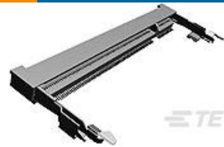
TE 系列/零件编号1473005-1 SEMI HARD TRAY DDR SOCKET 200P