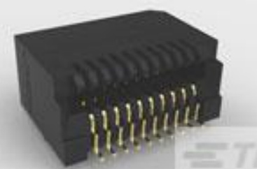
TE 系列/零件编号1888247-1 20 POS SMT CONN, SFP /SFP+, 30A