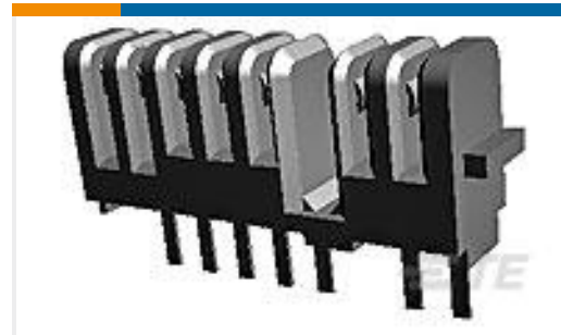
TE 系列/零件编号1747786-1 PACKING,REC. ASSY. 8POS. 2MM PITCH BATTE