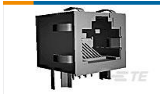
TE 系列/零件编号2-406541-3 MJ,INV,1X1,6PNL G,.100" ST,SN,NARROW POST