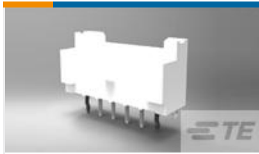
TE 系列/零件编号2132415-6 EP2.5 Shrouded HDR ASSY 6P VERT w/o boss