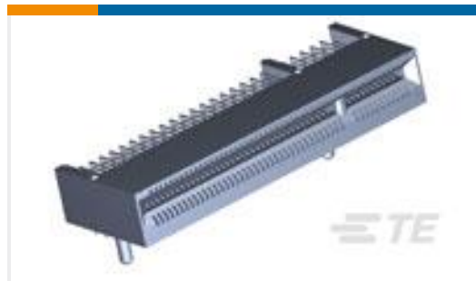
TE 系列/零件编号1-1761465-1 PCI Express RA assy 5.8 mm slot 3.1mm pc