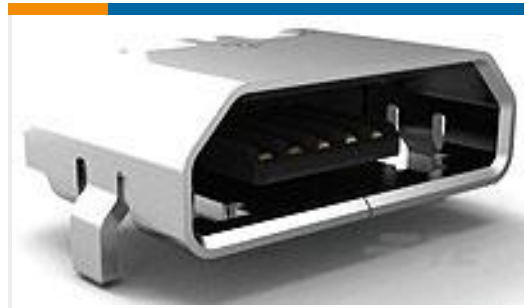
TE 系列/零件编号1932788-1 MICRO USB, TYPE B, REVERSE