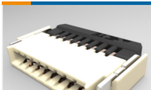
TE 系列/零件编号2328702-4 4PIN 0.5MMP FPC CONNECTOR,BACK FLIP LOCK