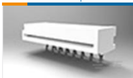
TE 系列/零件编号4-84533-0 1.25MM FFC POST PLATED H 40P