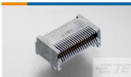
TE 系列/零件编号2110819-1 OSFP+ Enh EVERCLEAR PT Conn