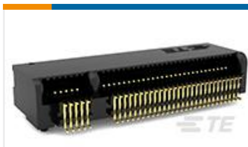
TE 系列/零件编号1- 2199230-6 M.2 0.5PITCH 4.2H KEY M 30U AU