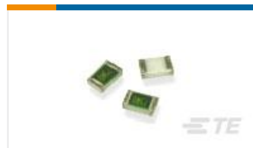
TE 系列/零件编号1676221-3 RN 0805 1K0 0.1% 10PPM 5KRL