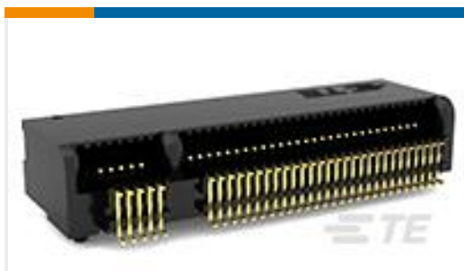
TE 系列/零件编号2199230-3 M.2 0.5PITCH 4.2H KEY B 15U" AU