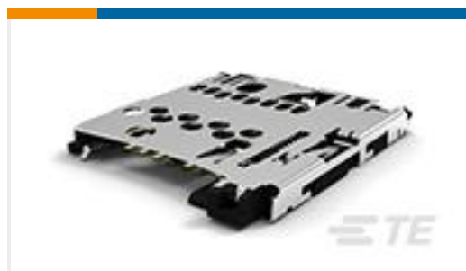
TE 系列/零件编号2201778-1 MICRO SD PUSH PUSH LOW PROFILE TYPE