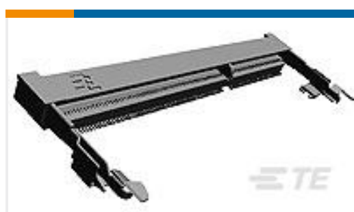
TE 系列/零件编号2- 2013022-1 EMBOSS TAPE DDR3 204P 4H STD