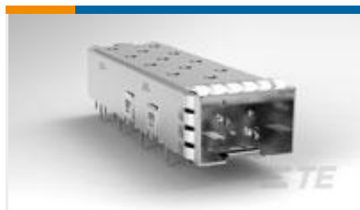
TE 系列/零件编号2007194-1 SFP+ 1x1 Cage Assembly, PCI, Solder Tail