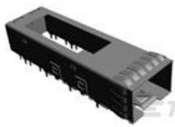
TE 零件编号2110304-1 SFP+ 1x1 Cage Assembly, Solder Tail