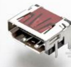
TE 零件编号1747981-2 Std HDMI, RA, SMT