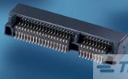
TE 零件编号1775862-2 mSATA/mini PCI-E 5.2H Type I G/F