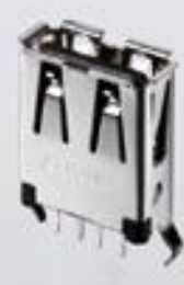
TE 零件编号1734366-3 Std USB Type A, VT, T/H, Blue