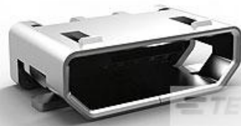
TE 零件编号2174507-2 MICRO USB, TYPE B