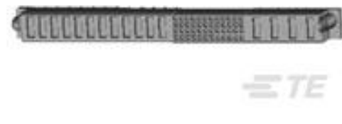
TE 零件编号6450863-5 MBXLE VERT RCPT 7ACP