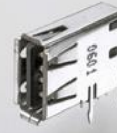
TE 零件编号1-1734775-1 Std USB Type A, Flag, T/H, 1.8A