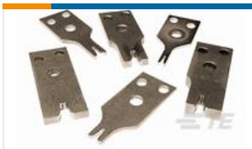
TE 零件编号3-562108-8 WIRE CRIMPER