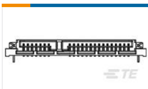
TE 零件编号2023246-2 ASS'Y SATA REC. R/A SMT TYPE 3.45H