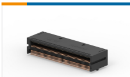
TE 零件编号2274845-1 CFP2 RECEPTACLE ASSEMBLY