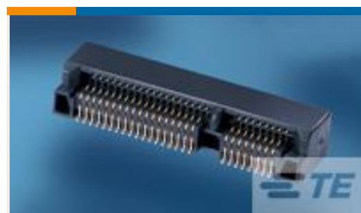
TE 零件编号1775862-2 mSATA/mini PCI-E 5.2H Type I G/F