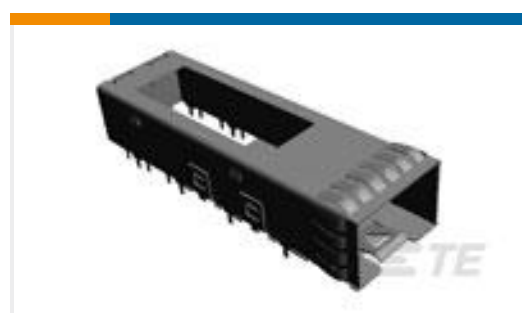
TE 零件编号2110304-1 SFP+ 1x1 Cage Assembly, Solder Tail