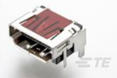
TE 零件编号1747981-2 Std HDMI, RA, SMT