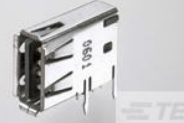
TE 零件编号1-1734775-1 Std USB Type A, Flag, T/H, 1.8A