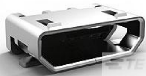
TE 零件编号2174507-2 MICRO USB, TYPE B