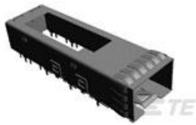
TE 零件编号2110304-1 SFP+ 1x1 Cage Assembly, Solder Tail