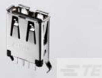
TE 零件编号1734366-3 Std USB Type A, VT, T/H, Blue