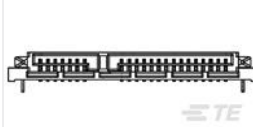
TE 零件编号2023246-2 ASS'Y SATA REC. R/A SMT TYPE 3.45H