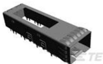
TE 零件编号2110304-1 SFP+ 1x1 Cage Assembly, Solder Tail