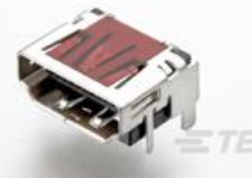
TE 零件编号1747981-2 Std HDMI, RA, SMT