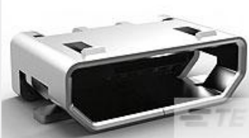
TE 零件编号2174507-2 MICRO USB, TYPE B