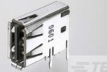
TE 零件编号1-1734775-1 Std USB Type A, Flag, T/H, 1.8A