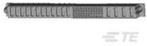
TE 零件编号6450863-5 MBXLE VERT RCPT 7ACP