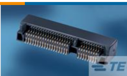
TE 零件编号1775862-2 mSATA/mini PCI-E 5.2H Type I G/F