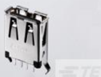
TE 零件编号1734366-3 Std USB Type A, VT, T/H, Blue