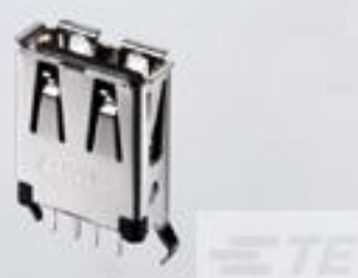
TE 零件编号1734366-3 Std USB Type A, VT, T/H, Blue