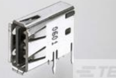
TE 零件编号1-1734775-1 Std USB Type A, Flag, T/H, 1.8A