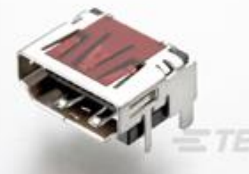
TE 零件编号1747981-2 Std HDMI, RA, SMT