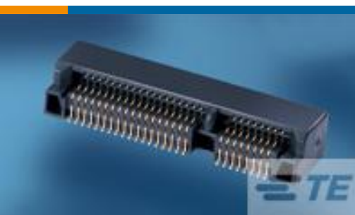
TE 零件编号1775862-2 mSATA/mini PCI-E 5.2H Type I G/F