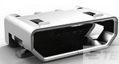
TE 零件编号2174507-2 MICRO USB, TYPE B