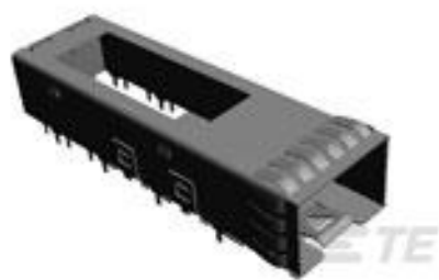
TE 零件编号2110304-1 SFP+ 1x1 Cage Assembly, Solder Tail