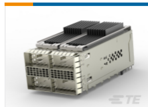
TE 零件编号1-2300832-7 Heat Sink Clip