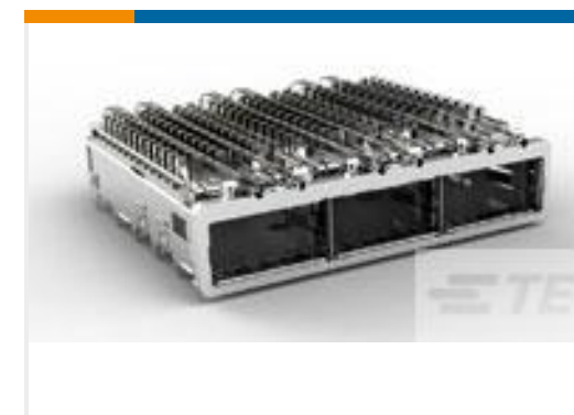
TE 零件编号2057042-9 1x3 QSFP Kit Assy LP&HS, Customized HS