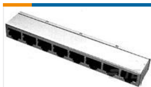
TE 零件编号5406967-8 INV MJ Assy, 1x8, PNL GRD