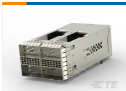
TE 零件编号2299870-4 THERMAL ZQSFP+ STACKED REC ASSEMBLY 2X2