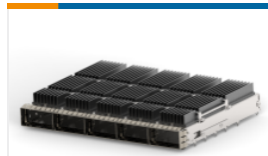
TE 零件编号2343986-2 RECEIPT CAGE ASSY 1X5 QSFP DD W HS