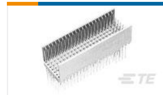
TE 零件编号5352157-1 Z-PACK/B MALE HDR 154P, .2MM HM