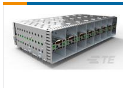
TE 零件编号1-2149490-7 SFP+ Assy 2x8EMI Spg Outer Lp Sn Enhance