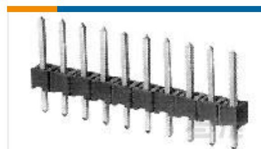
TE 零件编号2-103185-4 24 MODII HDR SRST B/A . 100CL