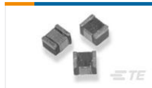
TE 零件编号5-1624112-0 3650 0402 24nH 5% 2K RL