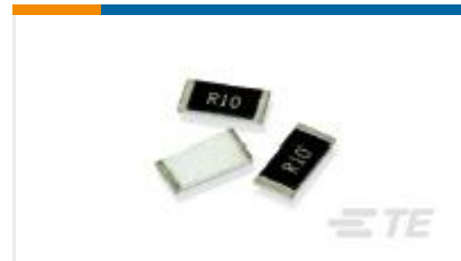
TE 零件编号1-2176056-2 RLP73M 2B R030 5% 5K RL