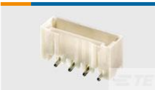
TE 零件编号292231-5 1.5 MINI CT SGL V SMT W /O BOSS