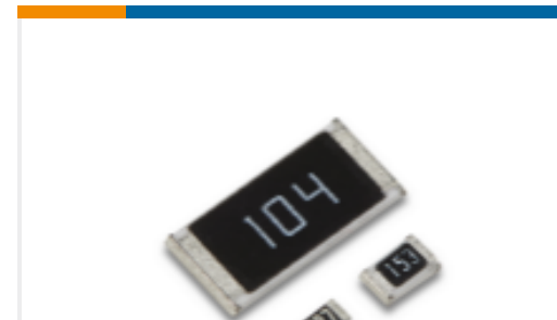
TE 零件编号4-2176337-6 CRGCQ 0402 56K 1%