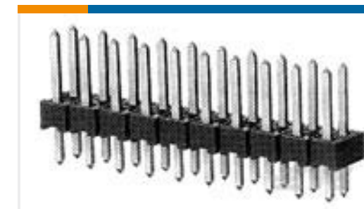
TE 零件编号5-146253-1 02 MODII HDR DRST B/A . 100CL LF