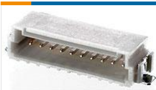
TE 零件编号292228-5 1.5 MINI CT SGL H SMT W /O BOSS