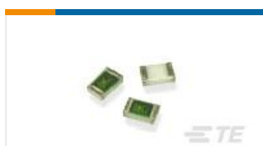
TE 零件编号3-1676731-0 RN 0805 499R 0.1% 5PPM 1K RL