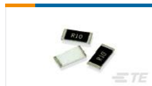
TE 零件编号1-2176054-0 RLP73N 2A R12 5% 5K RL