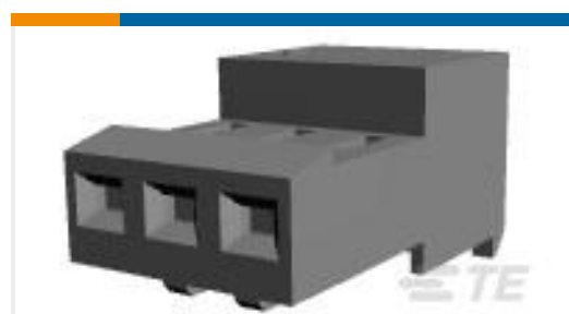
TE 零件编号3-640468-3 03P MTA100 CONN ASSY ON TAPE