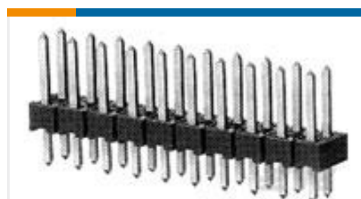
TE 零件编号1-826656-5 15P AMPMODU II STIFT LEI