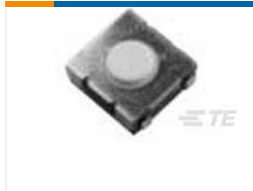
TE 零件编号1571625-1 TACT,6X6,SMT,J-LEAD, 50GF