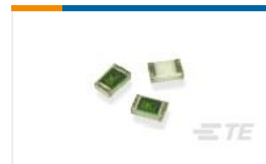
TE 零件编号8-1625868-5 RP 2A 0.25W 40R2 0.1% 25PPM 1K RL