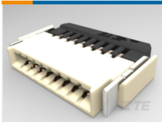
TE 零件编号2328702-4 4PIN 0.5MMP FPC CONNECTOR,BACK FLIP LOCK