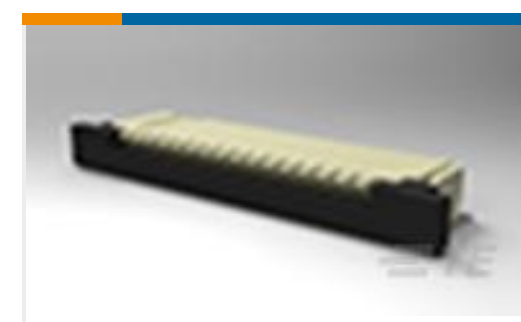
TE 零件编号1-84953-5 1MM FPC HORZ.TOP CONT.ASSY 15P