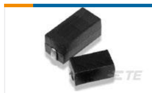
TE 零件编号5-1676966-5 SMW2 18R 5%