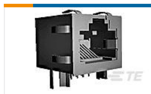
TE 零件编号2-406541-3 MJ,INV,1X1,6PNL G,.100" ST,SN,NARROW POST