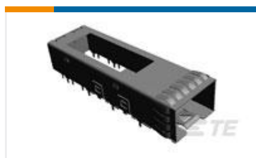
TE 零件编号2110304-1 SFP+ 1x1 Cage Assembly, Solder Tail