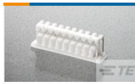
TE 零件编号440146-8 1.25mm WTB Socket, Housing,8p