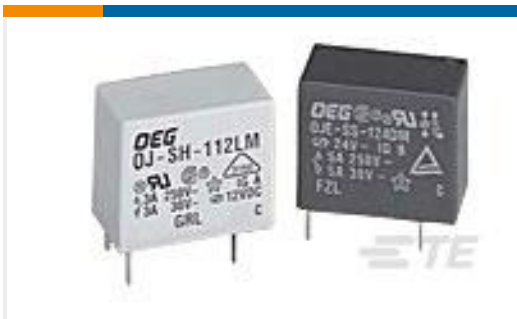
TE 零件编号1721870-5 OJE-SH-112LMHF,000