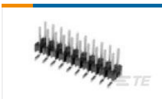
TE 零件编号5-146131-4 10 MODII HDR DRST SFMNT B/A LF