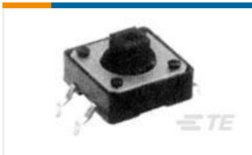
TE 零件编号1571627-1 FSM103A=TACT SWITCH, 260G