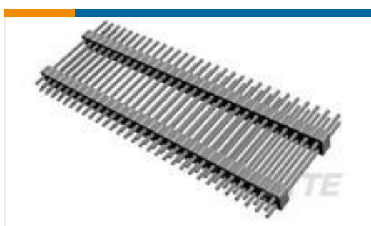
TE 零件编号3-829587-0 2X30P MOD2 STIFTLI