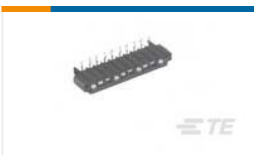
TE 零件编号5-520314-8 TRIOMATE ASSY H 8P L=2.54 LDFR