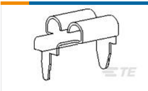
TE 零件编号1217107-1 FASTON 250 REC-TAB PTPPBR