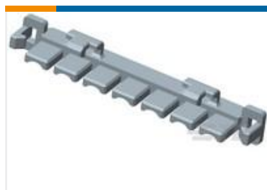
TE 零件编号1969609-3 3P VAL-U-LOK TPA 26-22 AWG