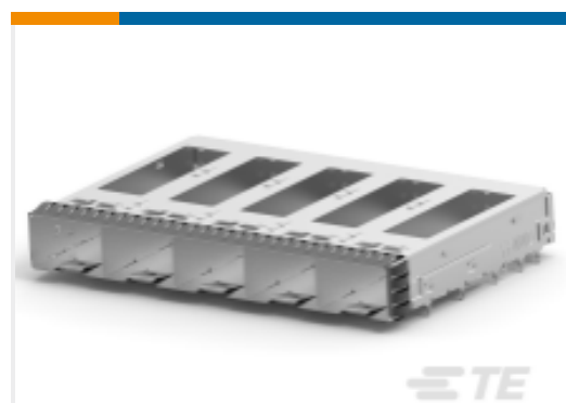
TE 零件编号2284170-1 SFP+ ENHANCED 1X5 CAGE ASSEMBLY PRESS FI