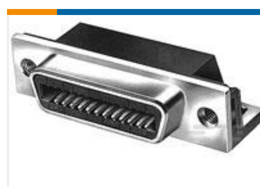
TE 零件编号5553811-4 ASSY,EMI RCPT,24 POSN, SCR LK