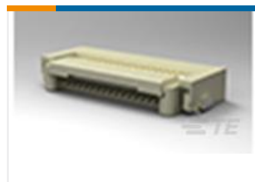
TE 零件编号3-1775333-0 ZIF FPC 0.5, 2H, 30P