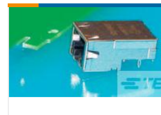
TE 零件编号1888250-5 Low Profile,RJ45,1x1,GRN /YEL