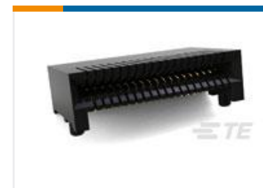
TE 零件编号1761987-5 Right Angle Receptacle 38 Posi