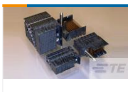
TE 零件编号2057406-1 IMP100S,R,RA2P16C,LG,46