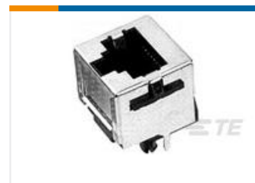
TE 零件编号1-1734577-4 MOD-JK,8P8C,SHD W /LED, G/G,50U"