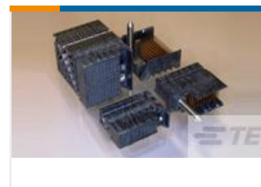
TE 零件编号1-2057691-1 IMP100S,R,RA3P8C,LG,39