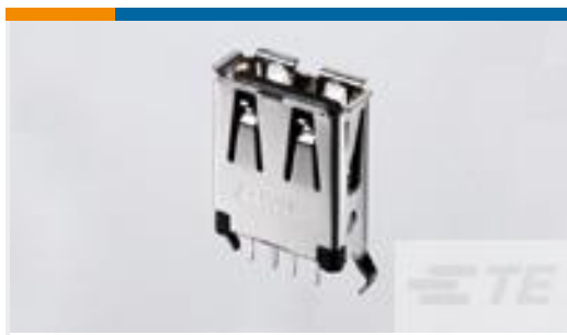
TE 零件编号1734366-1 Std USB Type A, VT, T/H